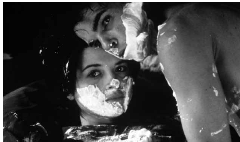
Boy Meets Girl et Mauvais Sang

Dans Mauvais Sang , les mêmes thèmes sont traités avec autant de force et touchent au sublime. Lavant est encore là, toujours aussi secret et romantique, guetté par la mort. Il joue à nouveau un Alex engagé cette fois par une bande de truands pour réaliser le vol d'un vaccin dans un laboratoire pharmaceutique. Il tombe alors sous le charme de la maîtresse de l'un des malfrats, Anna. Évidemment, le cinéaste ne se limite pas à cette trame narrative sommaire, il l'amplifie, l'amène dans les hautes sphères de l'amour fou et incontrôlable, jusqu'à son point de non-retour. Ses images prennent la mesure de cette agitation : elles alternent à un rythme fulgurant, prises dans un