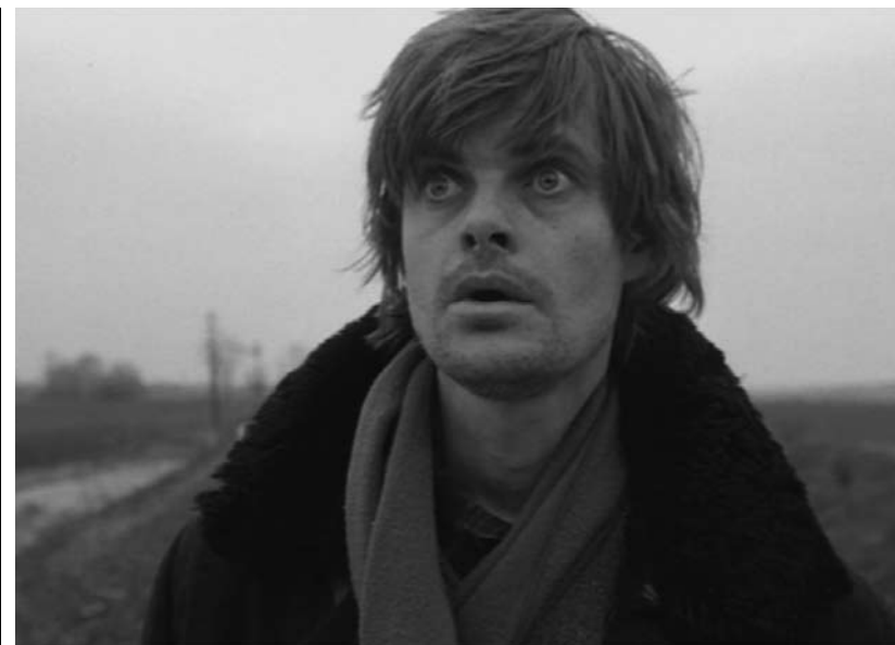
Damnation et Les Harmonies de Werckmeister de Béla Tarr

aussi d'un soutien affectif et familial. Comme le film de Makk, Adoption est un film de femmes. Des femmes qui souhaitent quitter leur solitude et trouver le bonheur — l'ouvrière le trouvera auprès d'un enfant, tandis que l'adolescente le cherchera auprès d'un mari. La filmographie de Mészáros, plus encore que celle de Karr, est un brillant exemple de la puissance et de la vitalité du cinéma d'auteur hongrois des années 1960-1970.