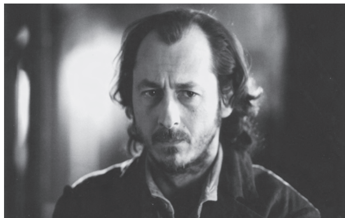
15 février 1839 — Photos 1 et 2: Collection Cinémathèque québécoise

comme rien. [Mais je] voyais bien les intellectuels arriver avec leurs objections quand j'ai commencé à dire que je voulais faire un film sur les patriotes. "Ah non, pas encore eux!" » Lorsqu'il s'agit de films politiques, le Québec et le Canada auraient-ils le tabou sélectif?