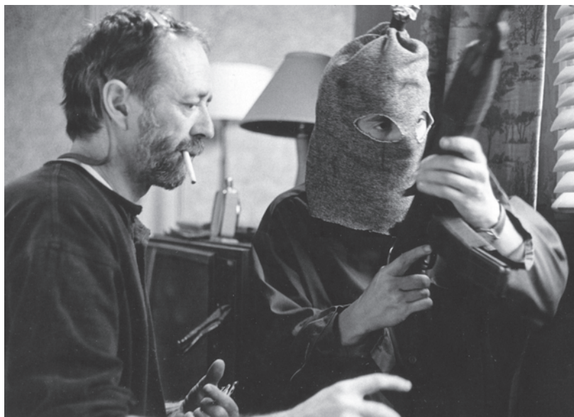
Tournage d' Octobre

Nous sommes tous, aujourd'hui, un peu orphelins de Falardeau. Artiste, homme de plume, homme de parole, homme de conviction: empêcheur de dormir en rond, objecteur de conscience, bouc émissaire...: choisissez celui qui vous convient, choisissez-les tous; ces visages faisaient partie du même homme. Un homme dont la combativité obstinée a suscité une onde de choc qui a marqué durablement notre culture et notre psyché. Car Falardeau était un révélateur, un miroir. Son pouvoir de faire dérailler le discours ambiant, de ramener, en outre, la question de l'indépendance à l'avant-scène de