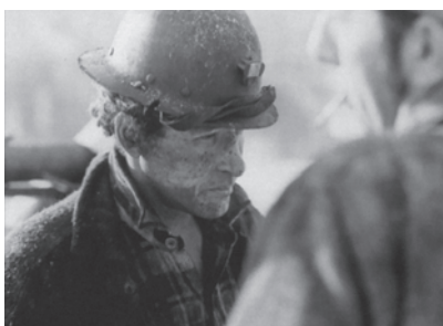
Pea Soup, Le Magra et Speak White