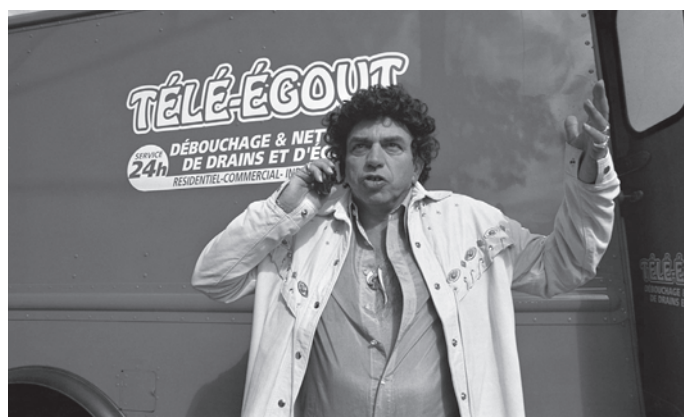
Elvis Gratton XXX: La Vengeance d'Elvis Wong