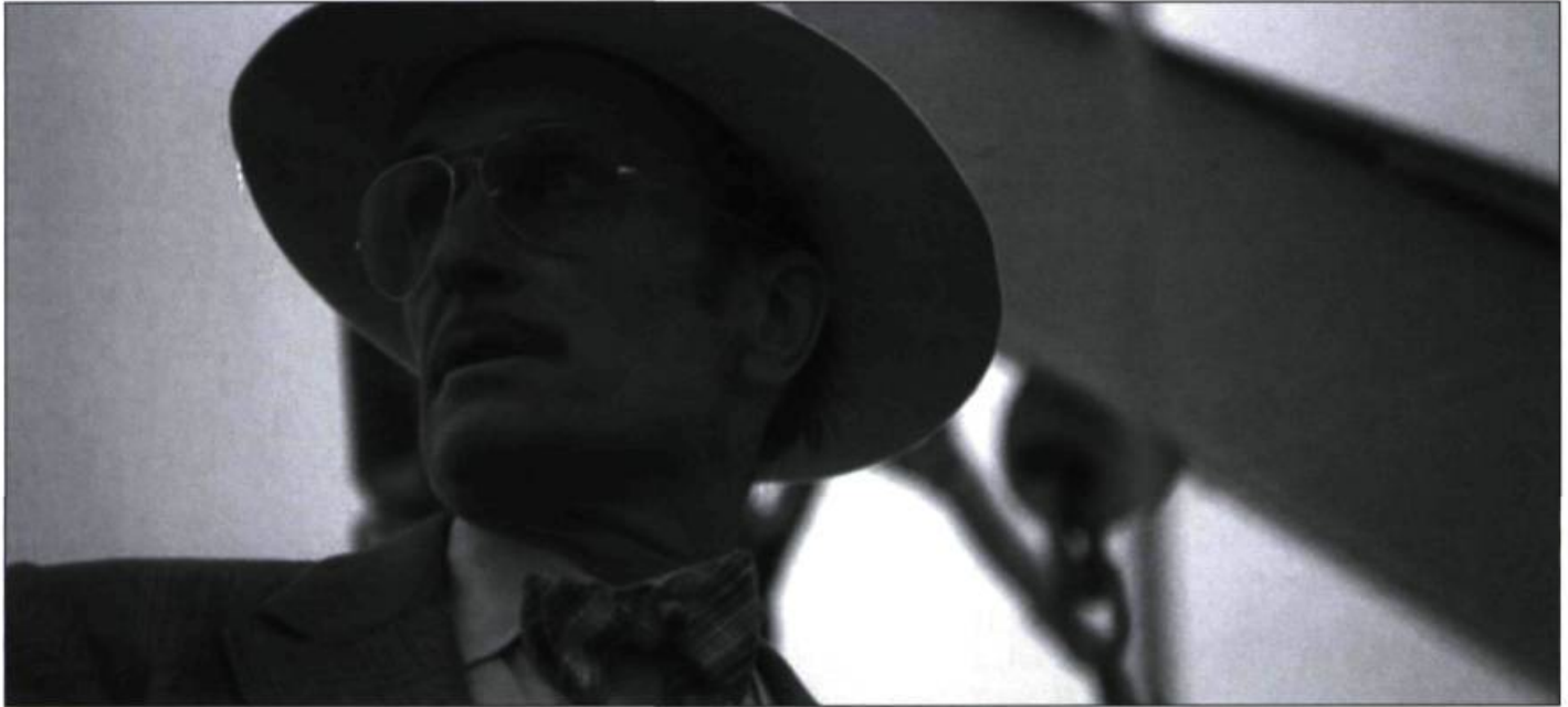
Robert Duvall dans The Lightship