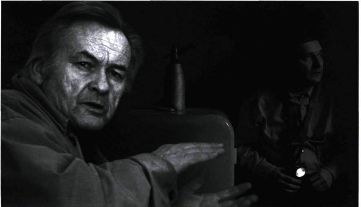
Jerzy Skolimowski tournant Quatre Nuits avec Anna