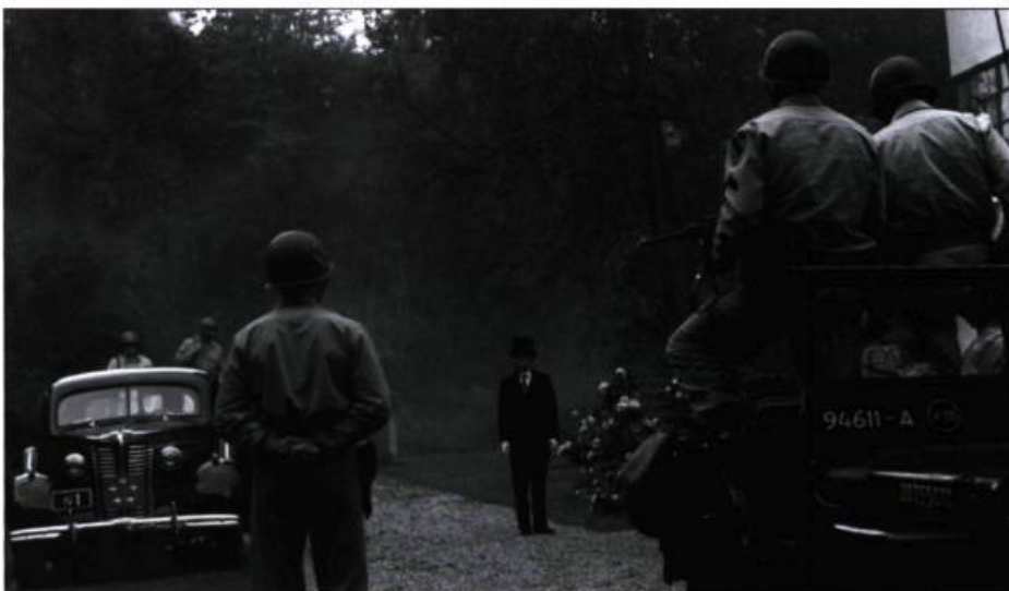
Le Soleil d'Alexandr Sokurov

Par cette évocation, le cinéaste russe transgresse une interdiction japonaise de représenter sous quelque forme que ce soit le dernier empereur nippon. Toutefois, Sokurov brosse un respectueux portrait d'un être profondément humain, loin