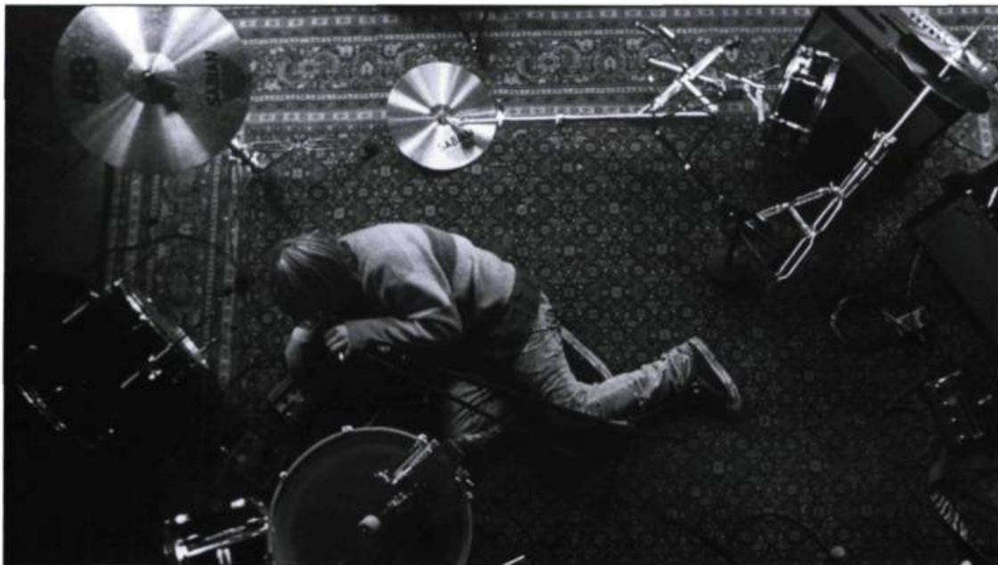
Last Days de Gus Van Sant

Que nous réserve le réalisateur américain dans un proche avenir? L'adaptation cinématographique de The Time Traveler's Wife , un roman de science-fiction d'Audrey Niffenegger où une femme possède des gènes lui permettant de voyager dans le temps. Encore une fois, Gus Van Sant surgit là où l'on ne l'attendait pas. ■