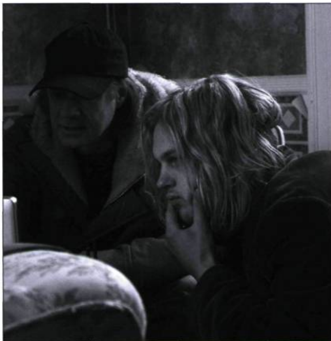
Gus Van Sant et Michael Pitt sur le tournage de Last Days

Le réalisateur, originaire de Louisville dans l'État du Kentucky, fait ses débuts dans le format long métrage en 1985 avec Mala Noche , film dont il est aujourd'hui difficile de retrouver la trace. Dès 1989, il attirera l'attention des cinéphiles de par le monde avec Drugstore Cowboy qui suit les péripéties d'une bande de paumés traînant leurs excès de motels cheaps en lieux peu recommandables. Bien des années plus tard, on peut constater l'influence de Drugstore Cowboy sur d'autres productions qui décrivent l'univers de jeunes défoncés comme, par exemple, Basketball Diaries de Scott Kalvert ou Trainspotting du cinéaste britannique Danny Boyle (dans le deuxième cas, les similitudes sont apparentes). Deux ans plus tard, Van Sant présente l'une de ses plus grandes réussites à ce jour : My Own Private Idaho met également en scène une certaine jeunesse désœuvrée (un thème récurrent dans l'œuvre du cinéaste) qui, en revanche, évolue sur fond de jeu théâtral. La réunion de River Phoenix et Keanu Reeves en prostitués-bourlingueurs ne s'effacera pas de sitôt de nos mémoires.