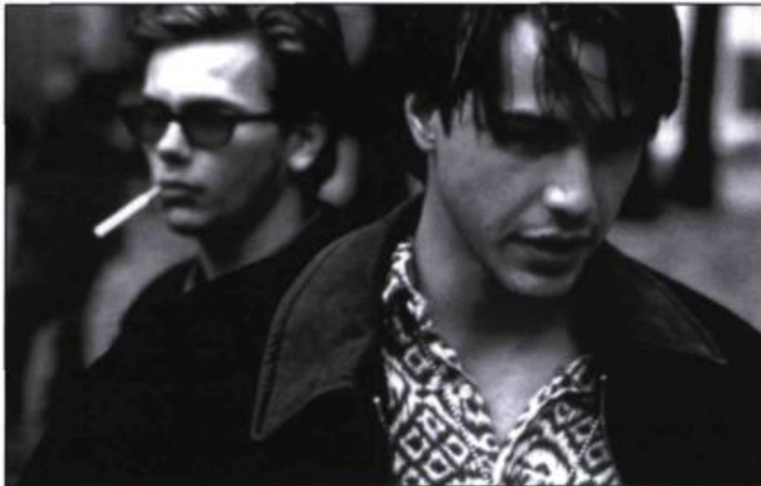
My Own Private Idaho

indépendant qui s'est laissé tenter par les grosses productions et la promotion en grande pompe qui accompagne leur sortie. Mais une fois de plus, le cinéaste revient là où l'on ne l'attendait pas. La surprise, pour ne pas dire l'OVNI, s'intitule Gerry (le prénom donné aux deux protagonistes), l'œuvre à la fois la plus radicale et la plus esthétique de l'auteur (des plans du désert sont d'une beauté saisissante). Pour ce film minimaliste à outrance qui renferme néanmoins des passages envoûtants, Van Sant fait appel de nouveau à Matt Damon et Casey Affleck (le frère de l'autre)... toutefois dans un registre totalement différent de celui de Good Will Hunting .