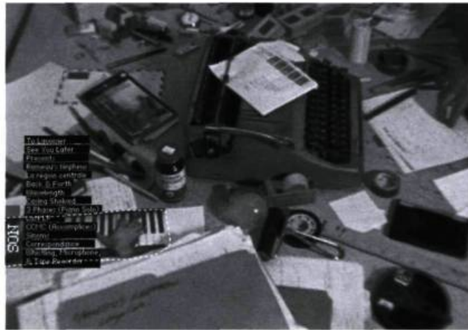
L'interface «sommaire» d' Anarchive 2 – Digital Snow

Si il faut nommer un artiste important du XX e siècle et toujours aussi actif dans le nouveau qui commence à peine, chercheur qui imprègne tout un pan de l'art contemporain et du cinéma expérimental, Michael Snow est assurément celui dont il faut retenir la contribution. Reconnu internationalement, maintes fois primé et actif depuis les 50 dernières années, il était dans l'ordre des choses de lui rendre un hommage à la mesure de son impressionnant et multiple parcours. Le Festival international nouveau Cinéma nouveaux Médias Montréal (FCMM) s'est donné ce mandat en offrant de nombreux événements qui nous ont permis de (re)découvrir le travail artistique de cet artiste 1 . Dans la foulée de ces moments consacrés à Michael Snow, il faut souligner le lancement du DVD-ROM Anarchive 2 – Digital Snow 2 , qui constitue autant une œuvre de l'artiste qu'une encyclopédie sur sa carrière.