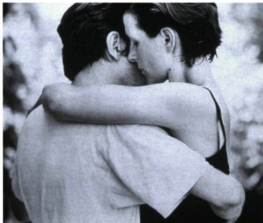
Alice et Martin d'André Téchiné