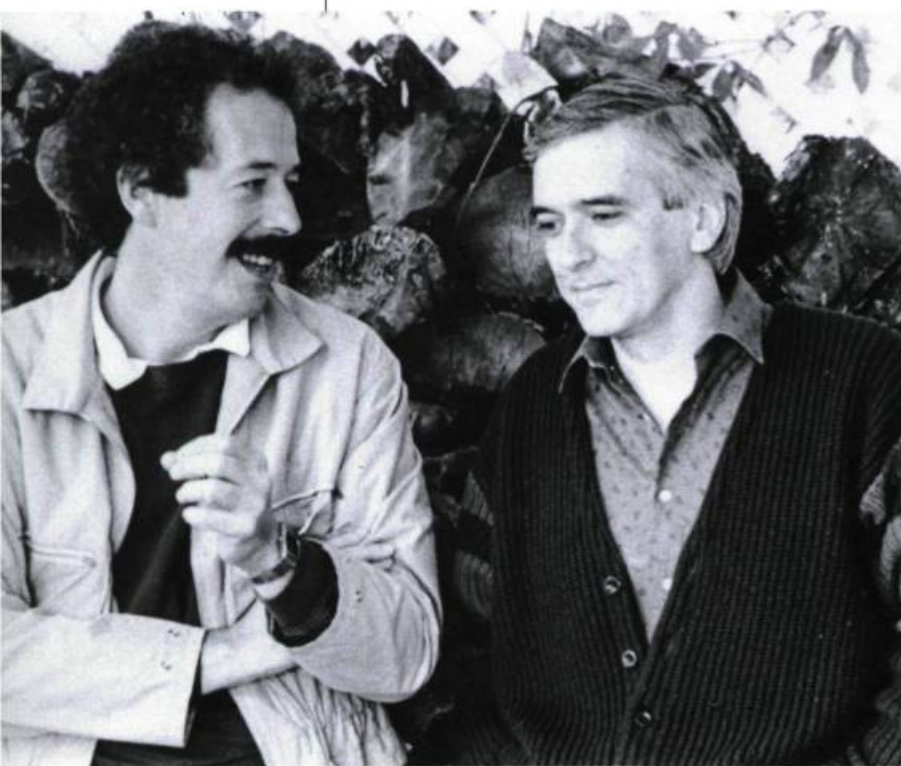
Denys Arcand et Roger Frappier sur le tournage du Déclin de l'empire américain

Roger Frappier: Ce n'est pas vrai. Nous avons de très bons scénaristes. Si seulement nous prenions plus de temps... Un de nos problèmes se nomme les saisons. L'été, c'est la grosse période. Si l'on fait un film «d'été», il faut le faire maintenant, sinon c'est reporté d'un an. Si le scénario n'est pas prêt, on croit pouvoir l'arranger en cours de route, donc on tourne. Il y a beaucoup de gens ici qui fonctionnent de cette façon. Tout le monde arrive au portillon en même temps. Le Déclin de l'empire américain a dû être un texte avant d'être un film... Le scénario, c'est vraiment la partie la plus difficile. Après, quand tout est bien fait, le reste est un plaisir. ■