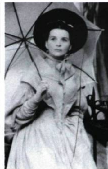
Pauline de Théus (Juliette Binoche)

Jean-Paul Rappeneau: Il y a quelque chose de valorisant à tout faire soi-même. Une part de mon énergie créatrice passait à m'échiner à écrire des histoires personnelles alors qu'en fait prendre une histoire existante, cela m'a un peu libéré. ■