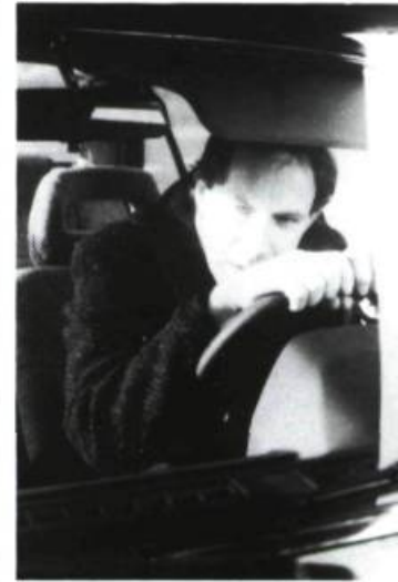
Décalogue 9 : Tu ne convoiteras pas la femme d'autrui