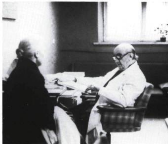
Décalogue 2 : Tu ne commettras point de parjure