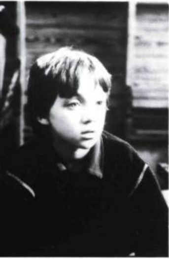
Décalogue 1 : Un seul dieu tu adoreras

films y renvoient presque constamment. Le propos est très clair dans Tu ne tueras point où un jeune désœuvré tue sans raison apparente un chauffeur de taxi et se retrouve lui-même mis à mort par l'appareil judiciaire qui ne cherche pas à comprendre son désespoir dans cette société qui le rejette.