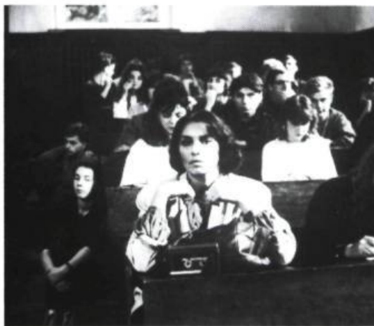
Décalogue 8 : Tu ne mentiras pas

Pour illustrer toute cette angoisse et proposer au spectateur une approche touchant davantage les questions métaphysiques que celles de la survie dans un environnement hostile, il importait à Kieslowski d'évacuer toutes ces images d'horreur et de misère. Il s'agissait plutôt de présenter en dix intrigues différentes, mais ayant toujours la même rigueur, une autre forme de misère, celle que la télévision ne montre jamais et qui se cache au cœur de l'homme d'aujourd'hui. Et si le Décalogue obtient une aussi grande audience, c'est sûrement grâce à la lucidité de ce cinéaste, qui, à l'égal de Bergman (la comparaison n'est pas trop forte), se pose une seule question : Dieu existe-t-il ? Et dix fois plutôt qu'une, Kieslowski ne donne pas la réponse mais démontre admirablement combien l'interrogation a encore tout son sens en cette fin de siècle où même les idéologies qui faisaient office de religion sont tombées en désuétude. ■