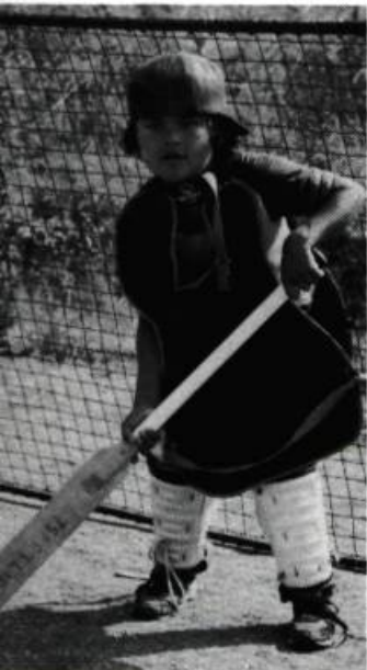
... l'avenir (Jeune indien de la nation Soanich)

Maurice Bulbulian : Cela découle d'une attitude globale : certains attendent depuis 500 ans. Ils sentent qu'ils ont le temps parce qu'ils savent que leur présence en terre d'Amérique date de 12 000 ans au moins, peut-être 50 000 ans. Mais il y a quand même des choses qui se passent depuis une centaine d'années qui font qu'ils sont en train de disparaître. Il y a 53 langues autochtones qui sont menacées de disparition d'ici la prochaine génération. Ceux qu'on appelle en anglais Elder , les Sages, qui sont encore très ancrés dans la véritable culture autochtone sont eux aussi en train de disparaître et, à chaque fois