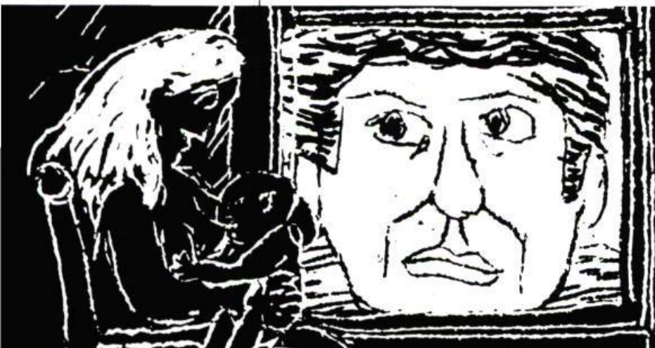
Souvenirs de guerre