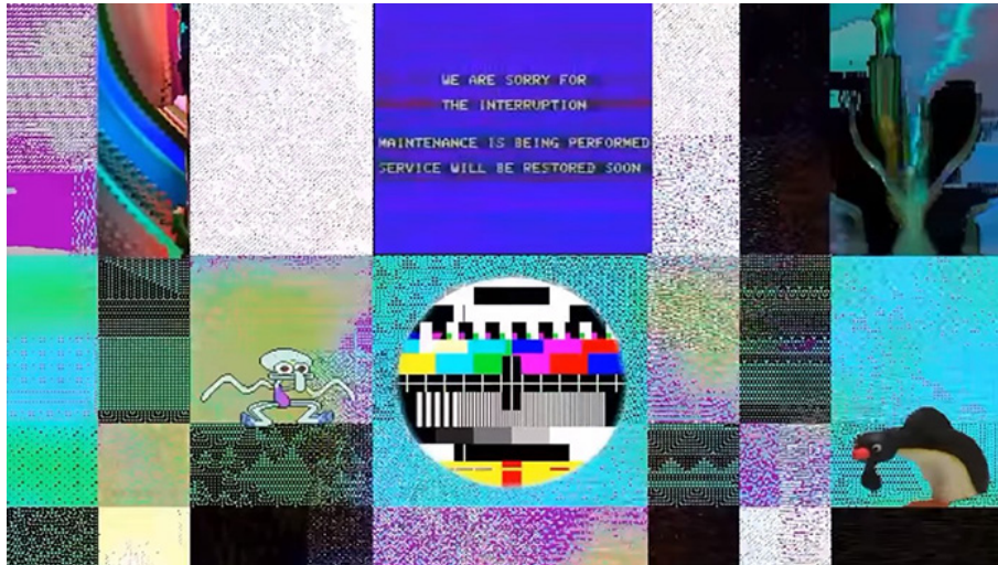
HortyUnderscore, Ça va Horthy? (2023)

secondaire » (Delbouille, 2019: 287) du streaming , puisque la situation de communication est temporairement transformée en compétition. L'introduction de bruit dans la performance représente, en d'autres termes, un moyen d'augmenter la jouabilité de la situation (la cacophonie est ludogène [Montembeault, 2022]) en rendant gratuitement laborieuses les actions les plus anodines.