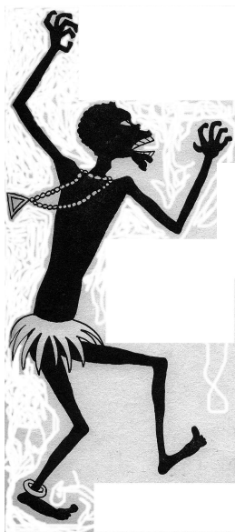
Diagne par Sennep dans Sennep (Jean), Cartel et Cie , Bossard, 1926