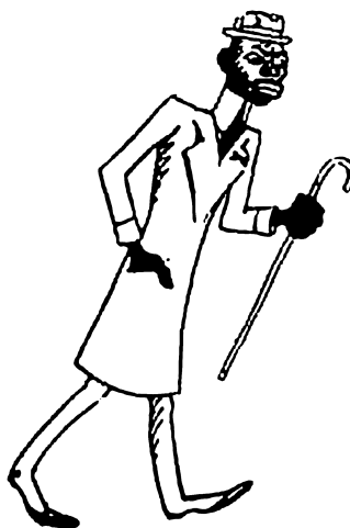
Diagne par Sennep dans Daudet (Léon), La Chambre nationale du 16 novembre, Nouvelle librairie nationale, 1923, p. 181-183.