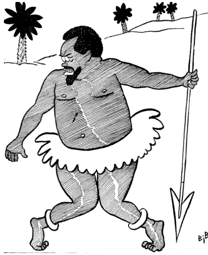
Candace par Bib dans la rubrique « Les vacances de la légalité », Le Charivari , n°378, 23 septembre 1933. « There are no bananas », lui fait dire Bib en rapprochant les projets bananiers de Candace aux bananes du pagne de Joséphine Baker.