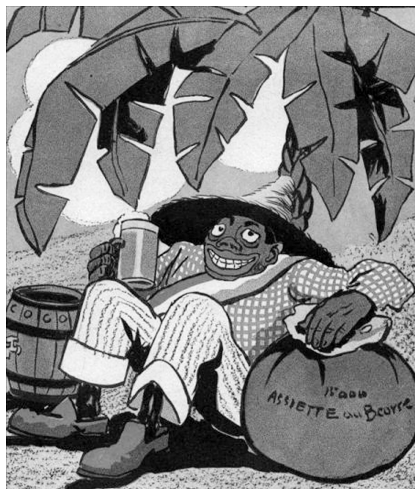
Légitimus par Leal da Camara, L'Assiette au Beurre , n°414, 6 mars 1909