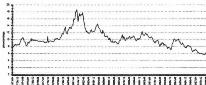
FIGURE II ÉVOLUTION DES RENDEMENTS DE L'OBLIGATION DU QUÉBEC 10 ANS

À première vue, il y a lieu de croire que les données sont non stationnaires. Pour le confirmer, nous allons effectuer le test statistique de racines unitaires de Dickey-Fuller. Ce test permet de vérifier le caractère aléatoire des données ; c'est-à-dire qu'il valide la stationnarité des données. Dans la mesure où les données seraient non stationnaires, l'utilisation des variations de rendement plutôt que des rendements eux-mêmes serait privilégiée.