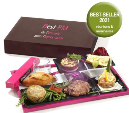
Plateau repas Best PM Entrée - Plat - Fromage - Dessert - Coup de pouce pour l'après-midi 17,90 € ttc / personne en livraison

Figure 3. Le plateau-repas « coup de pouce » pour jeunes actifs contient deux pilules d'amphétamines : « Best PM vous donne de l'énergie pour l'après-midi! » ( yume Design Studio , pour politic-fiction.fr , avril 2017).