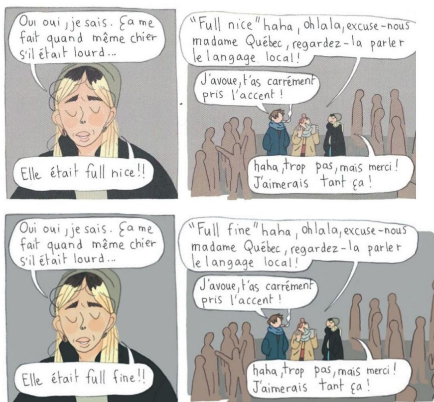
Figure 1 – Comparatif entre la version française et québécoise de la page 36 d' Adieu triste amour (la différence du bord droit de la deuxième page est uniquement liée à des questions de scan).

un public et un écosystème éditorial déjà constitués. Elle a ainsi dû apprivoiser une identité à la fois nouvelle et plus visible, dont la trace se perçoit nettement dans son travail, et qui la mène à la décision de donner deux éditions francophones à ses ouvrages. Ce transfert est d'autant plus fort que les albums de Pow Pow sont malgré tout différents des albums français. La question est marginale, mais quelques textes sont modifiés, alors même que les récits de Malle se passent à Montréal et sont en français québécois, mais un français québécois qui doit être compris par des Français et qui est donc validé avant publication par son éditrice. Au Québec, certains textes sont ainsi modifiés, laissant imaginer de nouvelles corrections, voire le rétablissement d'une volonté originale. Il s'agit en tout cas d'une intéressante négociation avec la québécité, qui mérite d'être étudiée.