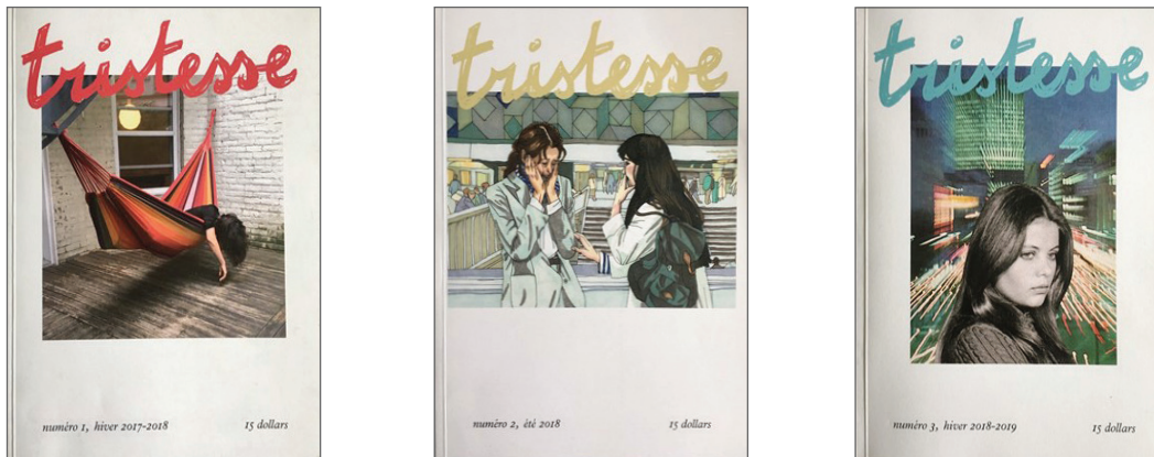
FIGURE 1 – Les couvertures des trois premiers numéros du zine Tristesse.

Une mise en page surprenante, efficace et, oui, satisfaisante à la fois par la disparition des poses et des postures trop souvent édifiées et valorisées par les publications. Tristesse , la revue comme l'émotion, annonce un fonds à explorer et surtout à accepter; il ne s'agit pas seulement de refuser l'impératif « souris, tu seras plus jolie », mais bien de révéler un mode cognitif par l'émotion, un rapport au monde qui n'a pas à se moduler et encore moins à s'excuser.