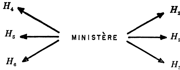
Schéma des échanges d'information

Mais il y a aussi possibilité de communiquer de l'information ; en général l'échange d'information est coûteux et très souvent n'intervient qu'une seule fois. Nous considérons ici le cas où cet échange ne peut avoir lieu qu'entre le ministère et chaque hôpital :