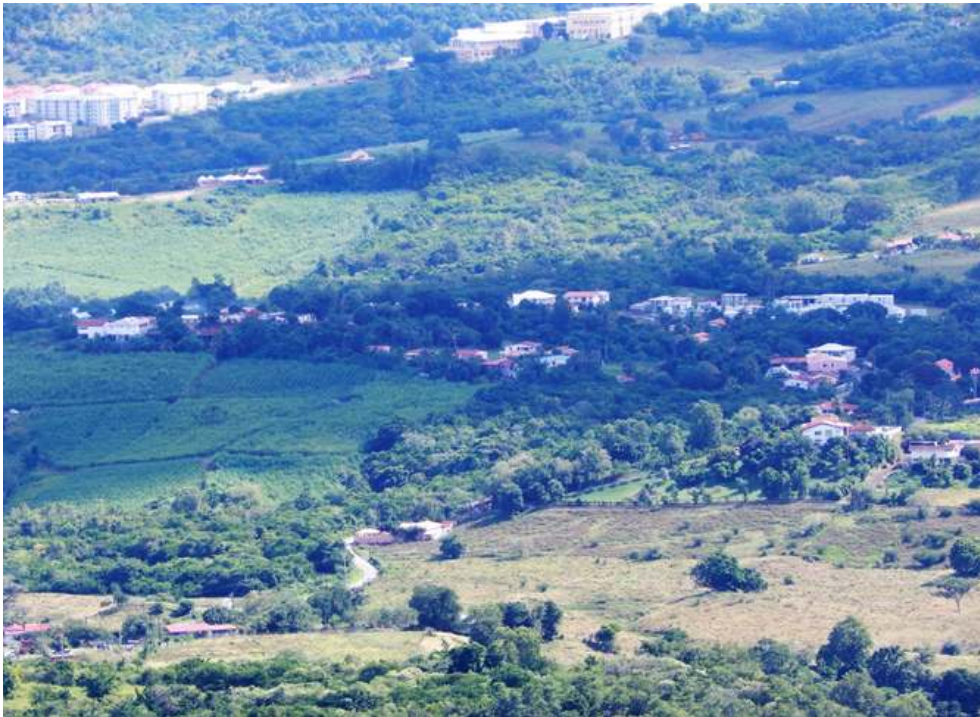
Figure 1. Un paysage fragmenté, connecté et hétérogène.