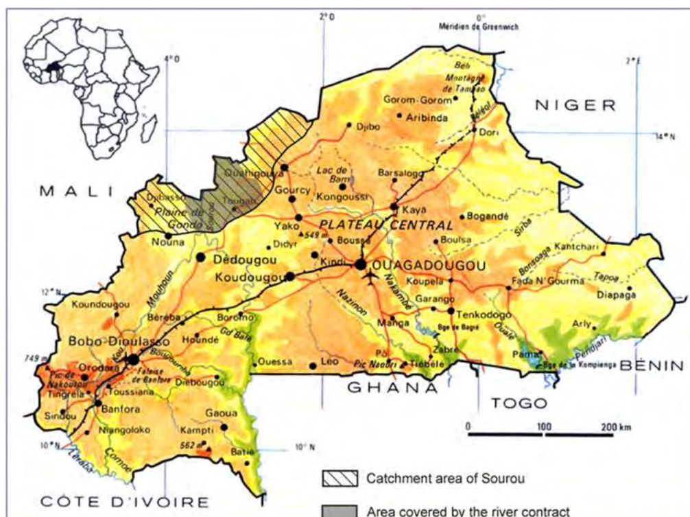
Figure 1. Zone couverte par le contrat de rivière du Sourou (Rosillon et Bado-Sama, 2006).

10 La vallée du Sourou est localisée au Nord-Ouest du Burkina Faso, dans la région de la boucle du Mouhoun. La rivière Sourou prend sa source au Mali au niveau de Baye. Elle fait frontière entre le Burkina Faso et le Mali pour ensuite traverser le Burkina du nord au sud avant de rejoindre le Mouhoun à sa confluence à Léri. Le bassin versant du Sourou occupe une superficie de 16.200 km 2 , mais c'est essentiellement la partie centrale du bassin située en rive gauche du fleuve (environ 5.000 km 2 ) qui fait l'objet de la présente étude (voir Figure 1).