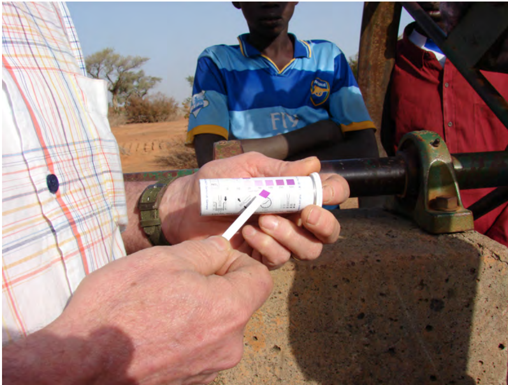
Figure 2. Estimation de la teneur en nitrates dans les eaux souterraines de la vallée du Sourou