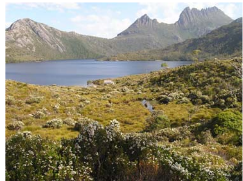
Figure 4. Dans les zones insulaires montagneuses, comme ici en Tasmanie, la pression d'espèces exotiques invasives reste faible.

En milieu insulaire, l'extension spatiale des plantes introduites est partiellement conditionnée par la distribution des perturbations d'origine anthropique ou naturelle (Jakobs et al., 2010). En Crête par exemple, le maximum altitudinal d' Oxalis pes-caprae tient clairement à un affaissement du niveau de perturbations anthropiques au-delà de ce seuil (Ross et al., 2008). De par leur taille, les petites îles subissent généralement des modifications qui portent sur l'ensemble de leur surface, à l'exception d'îles montagneuses, dont les parties élevées ou escarpées sont préservées (figure 4).