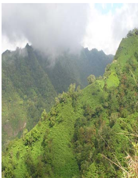
Figure 6. Zone dégradée envahie par des espèces ligneuses sur un relief montagneux escarpé en Polynésie Française

En revanche, les services culturels ne peuvent être qu'affectés dans une telle perspective de changement. La modification des paysages liée au bouleversement des formations végétales et au remplacement de certaines espèces indigènes ou exotiques par d'autres espèces exotiques peut être culturellement mal perçue. Ainsi en est-il de Dichrostachis cinerea , arbuste épineux très invasif sur la côte sous-le-vent de La Réunion, appelé à s'étendre en altitude avec l'élévation de la température, et qui supplante déjà les savanes herbacées. Celles-ci sont perçues comme l'une des composantes paysagères majeures des zones de basse altitude (CAUE, 1998).