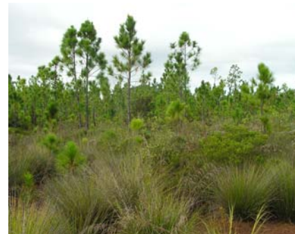
Figure 1. Invasion de Pinus caribaea sur des sols ultramaïfiques au sud de la Nouvelle-Calédonie (Cliché J. Tassin).

L'effet direct de la température sur les invasions biologiques demeure controversé (Gabriel et al., 2001). Les modèles traditionnellement utilisés, basés sur les niches climatiques, font généralement apparaître des extensions des zones couvertes par les espèces invasives (Thuiller et al., 2007). De tels modèles présentent toutefois le défaut de faire abstraction d'autres facteurs de contrôle tels que la pression d'introduction, les conditions de milieu et les interactions avec communautés d'espèces en présence. Dukes et Mooney (1999) observent ainsi que le réchauffement climatique peut tout aussi bien conduire à une régression de l'aire occupée par certaines plantes invasives.