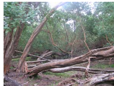
Figure 2. A l'île de Pâques, Acacia dealbata fut introduit pour la rapidité de sa croissance (Cliché J. Tassin)

contexte de fragilisation des habitats, des espèces indigènes d'intérêt patrimonial sont appelées à être transférées sur d'autres îles, à des fins de conservation (Richardson et al., 2009). En outre, les introductions porteront de manière privilégiée sur des espèces à croissance rapide (figure 2), dont on sait qu'il s'agit d'un trait de vie commun aux espèces invasives (Noble, 1989).