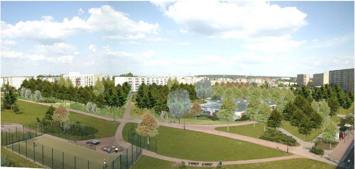
Figure 4. Silberhöhe : une future ville-forêt ?