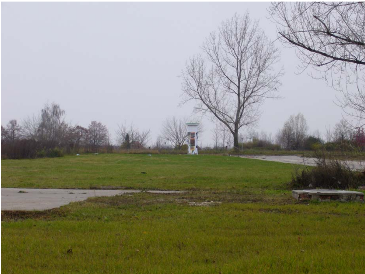
Figure 5. Silberhöhe : des immeubles de logements ont été démolis, mais des éléments de la vie urbaine demeurent.