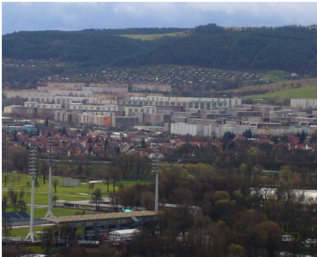
Figure 1. Un exemple de Plattenbausiedlung , Winzerla dans la ville de Iéna : la masse du quartier tranche dans le tissu urbain.

Ce déclin démographique et les difficultés du secteur économique ont conduit à la multiplication des logements et bâtiments inoccupés et des espaces en friche. En 2003, année où le nombre de logements vides a atteint son maximum, il était de 31 000 logements, soit 20% du stock (Fachbereich Stadtentwicklung und –planung, Netzwerk Stadtumbau, 2007b) Afin de gérer au mieux le devenir de ces espaces, et donc de l'ensemble de l'espace urbain, Halle a mis en place un schéma intégré de développement urbain. C'est une démarche rendue obligatoire par l'Etat fédéral dans le cadre du programme Stadtumbau Ost 4 , programme qui aide les villes des nouveaux Länder à faire face au défi du déclin 5 . Le schéma intégré de