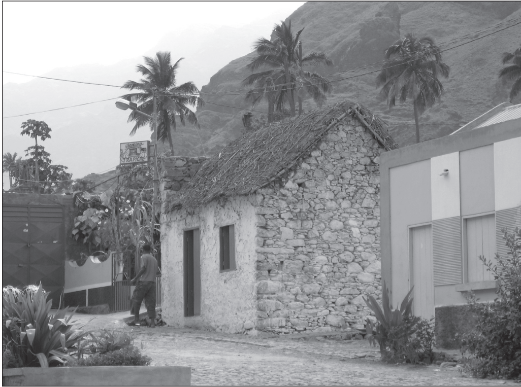
ILLUSTRATION 2 : Surinvestissement « expatrié » dans un environnement de grande pauvreté (Cap-Vert).

chambres d'hôtes, locations de villas, etc.) dans leur approche patrimoniale, les élus néorésidents, les amicales d'expatriés, agissent dans un fondamentalisme parfois ostracisant, s'opposant alors à ceux qui, restés sur place, voient dans le tourisme non pas une gêne ou un simple revenu complémentaire, mais un moyen indispensable à la viabilité de leur entreprise ou exploitation agricole.