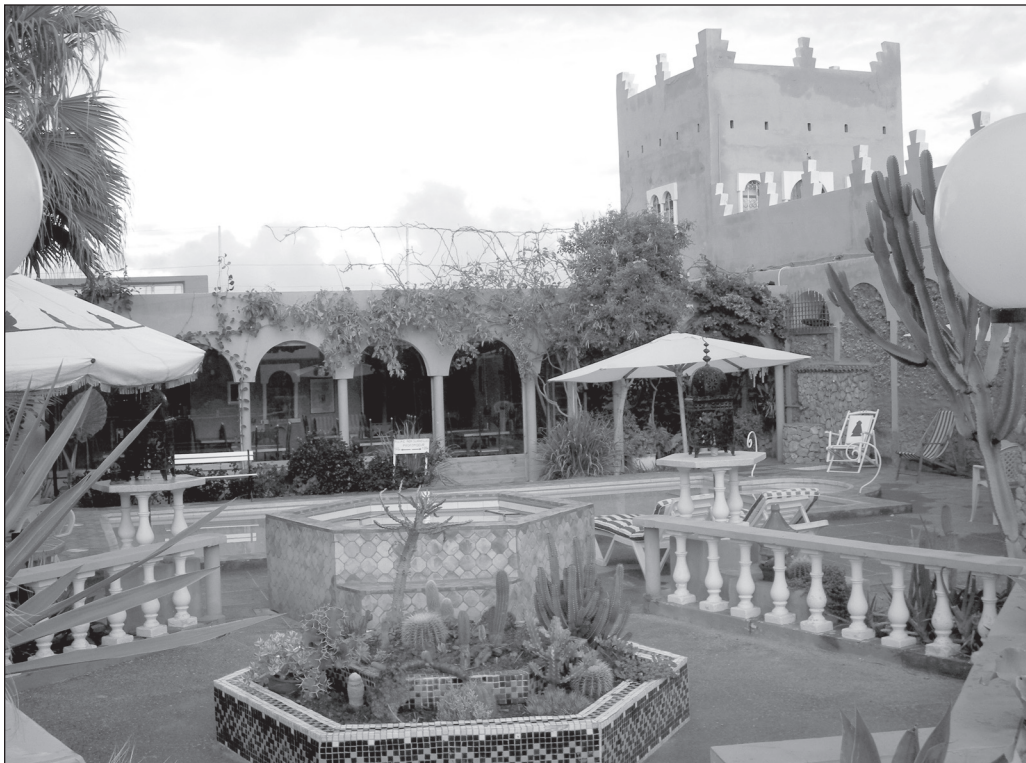
ILLUSTRATION 4 : Un « riad », propriété d'un « Pied-Noir », aménagé en résidence familiale et en pension de luxe (Maroc).

À l'économie originelle primaire ou secondaire, dans le cas des vieilles régions industrielles, on substitue des activités de loisir, ayant un fort impact conservatoire (elles prennent en compte et en charge le maintien et l'entretien de paysages, ou à tout le moins d'éléments de paysages, comme dans l'exemple précédent de l'olivieraie associée à la résidence secondaire) dans un cadre de vie dédié au récréatif, à l'exemple de la grange devenue chambre d'hôte ou de la borie (abri en pierres sèches) initialement bergerie, devenue local technique de la