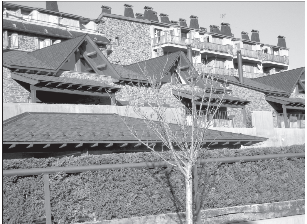
ILLUSTRATION 3 : La résidentialité barcelonaise « identitaire » et la reconfiguration du paysage montagnard (Cerdagne) (photo : Philippe Bachimon).

L'impact territorial et paysager va dépendre de l'importance de l'investissement, de son positionnement par rapport à d'autres modalités touristiques. Ainsi y a-t-il peu de rapports entre un village d'une campagne banale où la seule résidentialité secondaire est celle de descendants lointains qui viennent de loin en loin et le retour dans une station touristique de familles émigrées.