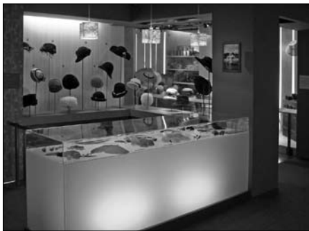
Illustration 3 : Exposition «Travailler du chapeau – Le chapelier et le modiste» (18 mai au 10 novembre 2007), Musée de Bretagne, Rennes.