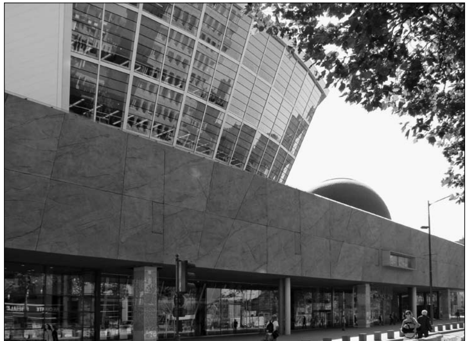
Illustration 1 : Les musées de société à vocation identitaire : Exemple du Musée de Bretagne, Rennes.

Sur le premier point, il est bien évident que, comme nous sommes entrés – avec les technologies de l'information et de la communication (TIC) et plus encore avec l'avènement du Web 2.0 – dans une nouvelle « ère cognitive » (Lévy, 1994), nous voici également désormais dans une « ère du loisir » qui, au-delà des affrontements de valeurs qui n'ont jamais été aussi prégnants en France, apparaît désormais comme un « état de fait » difficilement discutable. Si l'on considère la réduction et la réorganisation du temps de travail, l'allongement de la durée de vie et la pratique culturelle des « jeunes retraités » au fort pouvoir d'achat, on comprend fort bien que ces modifications structurelles autant que conjoncturelles affectent de façon