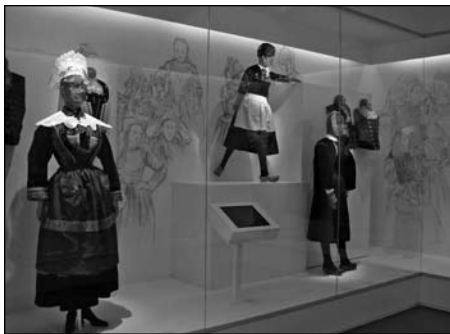
Illustration 2 : Exposition «Travailler du chapeau – Le chapelier et le modiste» (18 mai au 10 novembre 2007), Musée de Bretagne, Rennes.