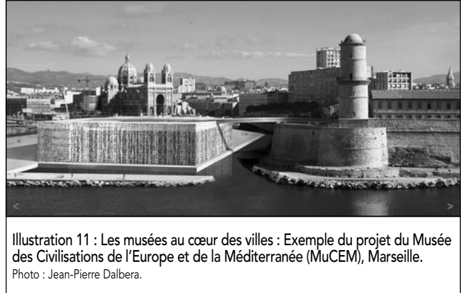
Illustration 11 : Les musées au cœur des villes : Exemple du projet du Musée des Civilisations de l'Europe et de la Méditerranée (MuCEM), Marseille.