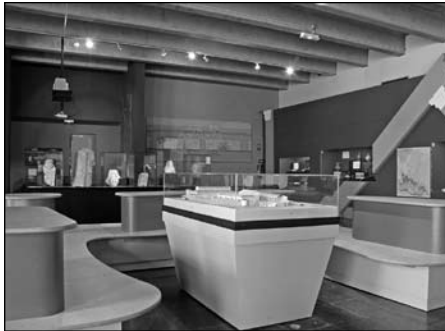
Illustration 8 : Musée archéologique de Bavay.