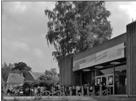
Illustration 7 : Musée archéologique de Bavay.