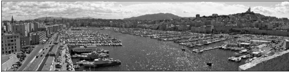
Illustration 14 : Vieux-Port de Marseille.