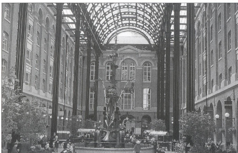
L'héritage du commerce au long cours au service de la régénération urbaine.

Lorsqu'elle accède au trône en 1837, la reine Victoria aurait difficilement pu soupçonner l'envergure des bouleversements qui affecteraient Londres durant son règne de 64 ans. L'explosion urbaine, favorisée par le transport ferroviaire, poussera les terrasses dans toutes les directions. La population passera, en un peu plus d'un siècle (1801-1911), de 1,1 million d'habitants à plus de 7,2 millions. Le développement du commerce au loin nécessitera la construction de vastes docks destinés à décongestionner la Tamise et à faciliter