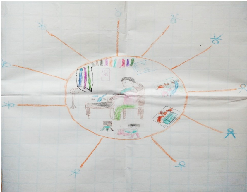
Figure 2 Logo du groupe de recherche créé par les co-chercheur.e.s

Quelques-unes des entrées du carnet relatent les activités de recherche au cours desquelles la chercheuse et les co-chercheur.e.s ont travaillé à l'établissement de leur groupe de recherche et à la création de son logo ou de son identité visuelle. Lorsque les co-chercheur.e.s ont décidé de créer un logo en tant que groupe (voir Figure 2), ils.elles ont placé la chercheuse comme une figure proéminente (dans le cercle central avec les différents outils de collecte de données). À cet égard, l'adulte représentait l'étude de recherche et les activités dans lesquelles les co-chercheur.e.s étaient engagé.e.s. Alors que les co-chercheur.e.s décrivaient la chercheuse comme un point d'ancrage qui maintenait le groupe de recherche ensemble et organisait les activités de recherche, c'était aussi un aperçu du déséquilibre de pouvoir qui est toujours présent dans la relation et les interactions entre un.e chercheur.e adulte et de jeunes co-chercheur.e.s. Par conséquent, la réflexivité est devenue nécessaire pour surveiller en permanence les déséquilibres de pouvoir qui pouvaient se manifester sous des formes subtiles au cours du processus de recherche.