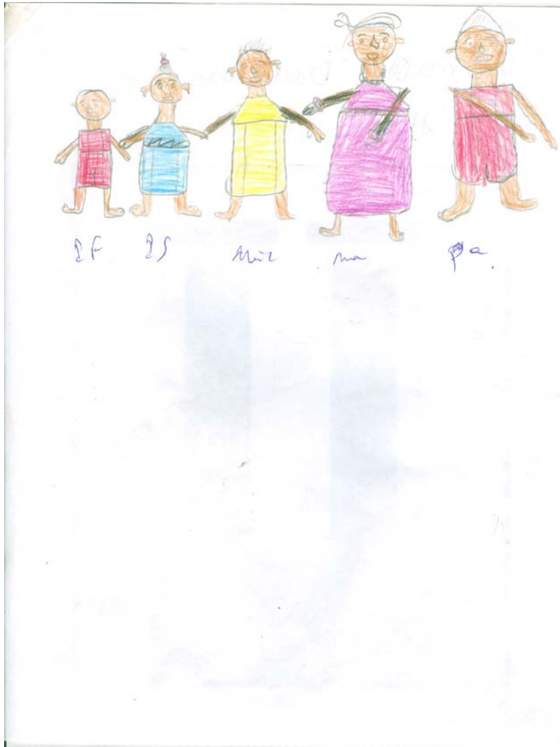
Figure 3. Le dessin de la famille réelle.

La couleur est indicative de l'affectivité (Anzieu, 2008; Kim Chi, 1989; Olivero Ferraris, 1980) et renseigne sur la signification du personnage pour l'enfant (Porot, 1965). Astou a choisi le rouge pour le dessiner, couleur du drapeau, qui peut être symbole de puissance agressive (Bédard, 2007; Duborgel, 1976) et de force active (Kandinsky, 1969; Merleau-Ponty, 1945;