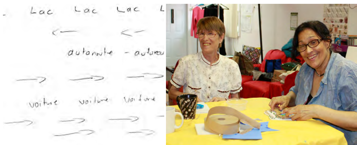
Figure – 7 Participantes à l'œuvre sur le projet Créative Jonction

Alors que certains participants étaient intéressés par un média particulier, d'autres ont profité des ateliers pour explorer différentes formes d'expression. Tous souhaitent découvrir autrement leur quartier. Trois entretiens semi-dirigés, réalisés avec des participantes, confirment les propos de l'organisme partenaire, soit que la variation des modes de représentation proposés fut très appréciée. Le passage du son à l'écriture a suscité le plus grand enthousiasme. Ce dispositif artistique générait plusieurs dynamiques de relais : l'exploration de divers modes de représentation et de réception, la constante circulation des personnes dans les ateliers, le déplacement physique dans le quartier, ainsi que le passage d'actes de création individuels à collectifs à travers divers objets de contact.