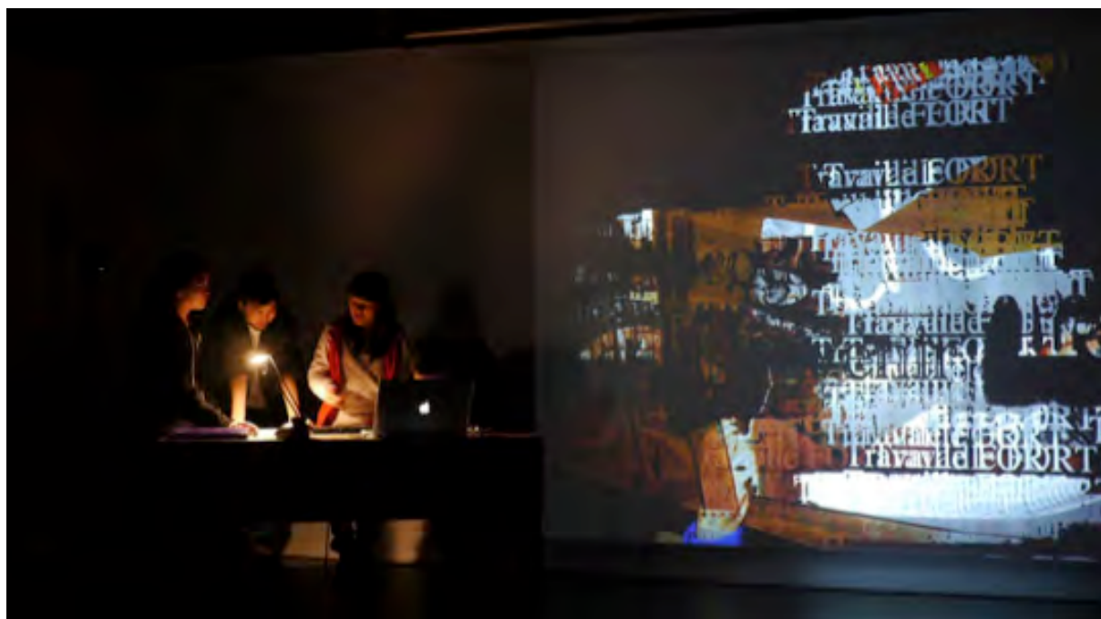
Figure 6 – Performance par des élèves du projet Fais ta valise avec tes droits!