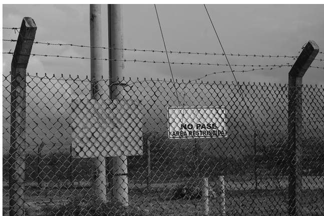
Figure 4 Grillages de la zone Puerta Bolívar (Photo de L. Simon, 2010)