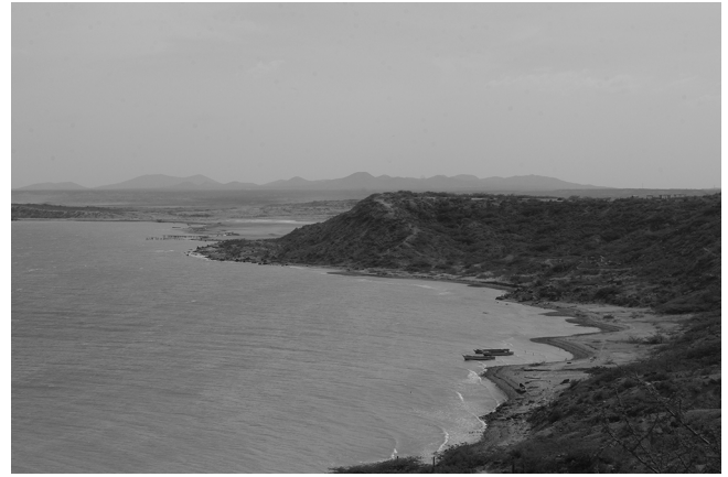
Figure 3 Vue sur la baie de Media Luna, aussi appelée baie de Portete

Couplé à la condensation démographique due à la restriction des territoires disponibles, ce facteur écologique constitua donc un bouleversement de l'économie des populations. Mais outre la ressource alimentaire que