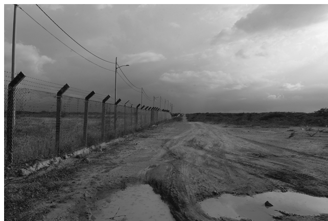
Figure 5 Grillages de la zone Puerta Bolívar

dizaines de kilomètres de là; cette distance les place en quelque sorte dans une situation de marge au regard des avancées de la « civilisation » (selon leur propre terme 7 ) sur la péninsule. Car c'est par Uribia que transitent les budgets censés être alloués au développement des projets communautaires 8 de toutes les populations vivant au nord de la Guajira. En ce sens, Uribia est un centre névralgique où se synthétisent les potentialités de développement susceptibles de satisfaire les populations dans leurs aspirations et leurs projets. Les communautés doivent négocier avec la mairie, sur la base d'un projet concret, pour bénéficier de ces budgets prévus par le gouvernement colombien. Il appartient ainsi à chaque communauté de faire valoir ses visées collectives pour tirer profit de ces enveloppes. Cette procédure implique deux éléments importants. D'une part, elle suppose un certain dynamisme et une certaine créativité de la part des communautés pour imaginer ses propres projets (je reviendrai là-dessus au point suivant); d'autre part, elle requiert la visibilité de la communauté, via un représentant chargé du contact avec la mairie.