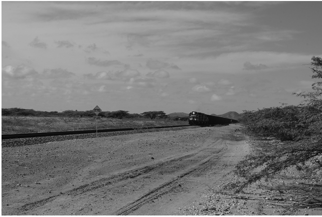
Figure 2 Chemin de fer traversant les étendues de la Guajira

sautent aux yeux lorsqu'on regarde, depuis l'extérieur, en direction des grillages. Il y a les treillis tout d'abord. Ils constituent une frontière que les panneaux « Zona Restringida » contribuent à rendre explicite (fig. 4). Les rondes qui s'y effectuent et les vigiles à l'entrée terminent un travail de dissuasion déjà fort efficace. Il y a aussi les lignes à haute tension. Elles s'élancent en direction du port et s'arrêtent au pied des treillis. Des lampadaires éclairent le tracé de la frontière, offrant une rupture plus notable encore de nuit que de jour (fig. 5). La pénombre de la savane s'arrête alors sur les remparts de lumière. Mais si ce n'était à titre dissuasif, les barrières et infrastructures de la compagnie n'ajouteraient rien au contraste entre le dedans et le dehors de la zone. La couverture végétale qui s'étend à perte de vue 6 dans l'enceinte de la compagnie offre une discontinuité remarquable avec le sol rocailleux de l'extérieur de la zone logistique. La coupure est d'autant plus sévère que les étendues végétales sont inexploitées sur plusieurs centaines de mètres.