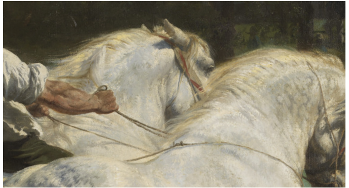
Figures 4 (page ci-contre) et 5. Rosa Bonheur, Marché aux chevaux, détails, 1853-1855, huile sur toile, 244,5 x 506,7 cm, New York, Metropolitan Museum of Art.

mal désemparé roulent vers l'arrière et cherchent à identifier la source de son malheur. Le hennissement produit par sa bouche ouverte et ses naseaux dilatés témoigne de sa détermination à fuir la situation.