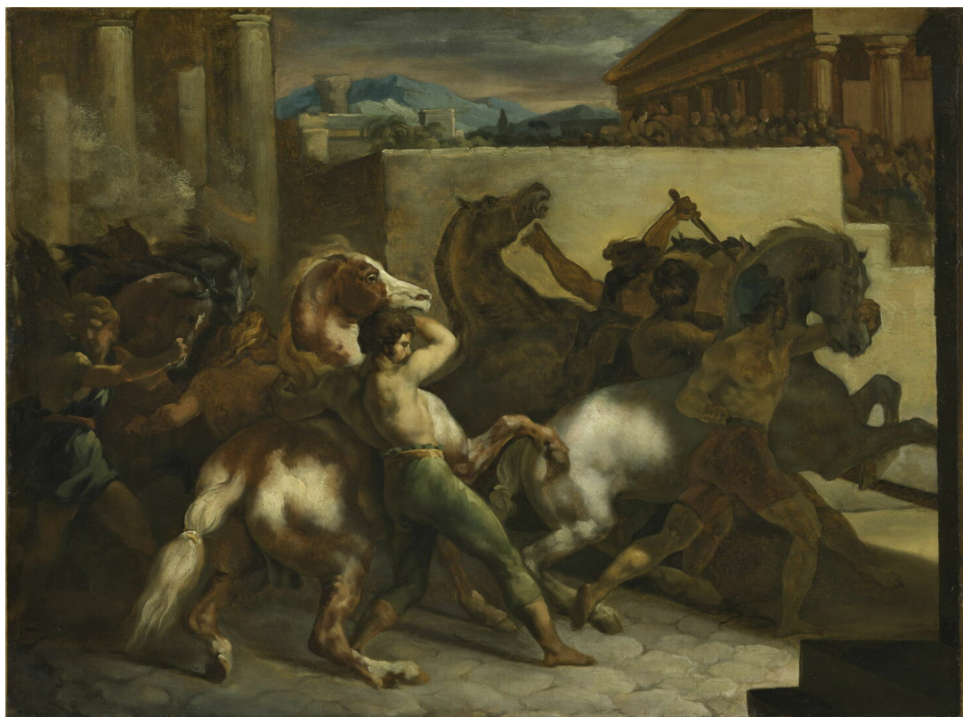
Figure 3. Théodore Géricault, Course de chevaux libres à Rome , 1 er quart du XIX e siècle (1800–1825), huile sur papier collé sur toile, 45 × 60 cm, Paris, Louvre.