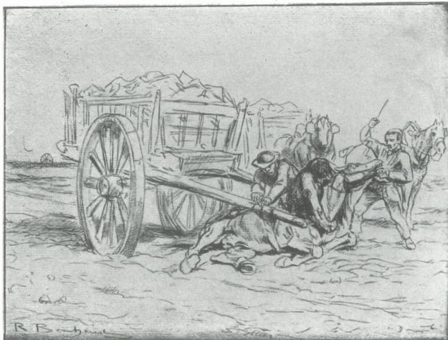
Figure 2. Rosa Bonheur, Les tombereaux de pierres , reproduction tirée de Rosa Bonheur, sa vie, son œuvre , par Anna Klumpke, p. 180.