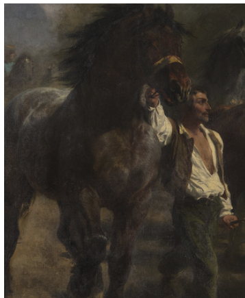
Figure 12. Rosa Bonheur, Marché aux chevaux , détail, 1853–1855, huile sur toile, 244,5 x 506,7 cm, New York, Metropolitan Museum of Art.

Bien que composée sur le même plan que les autres figures du tableau, la relation entre l'homme et le rouan est en substance si radicalement différente de celle qui caractérise les autres interactions interspécies sur la toile que, comme un collage, le couple semble avoir été transposé d'ailleurs, découpé d'un contexte différent puis ajouté à la scène. Ils sont psychologiquement détachés des relations dysfonctionnelles qui les entourent. Ils