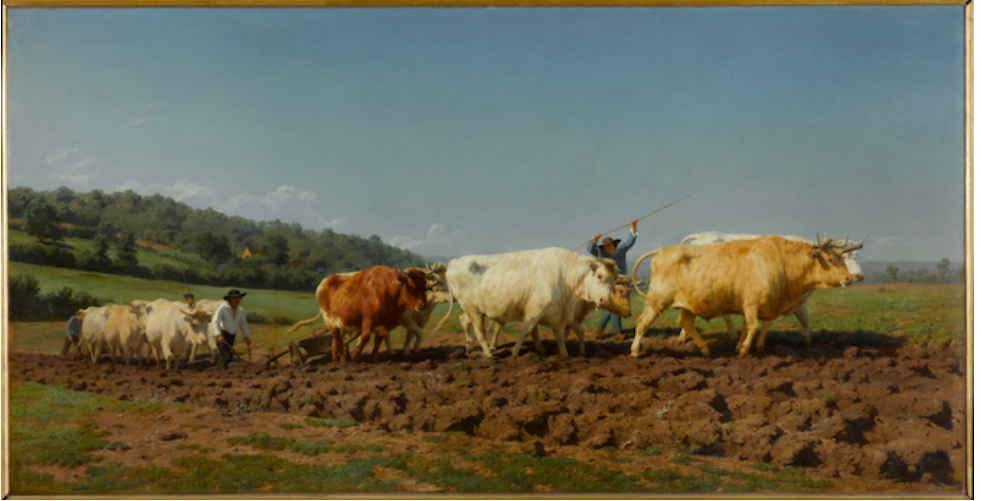
Figure 8. Rosa Bonheur, Labourage nivernais , 1849, huile sur toile, 133 × 260 cm, Paris, Musée d'Orsay.