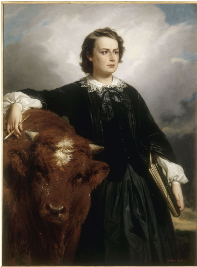
Figure 9. Edouard Dubufe et Rosa Bonheur, Portrait de Rosa Bonheur , 1857, huile sur toile, 130,5 × 97 cm, Musée national des châteaux de Versailles et de Trianon.