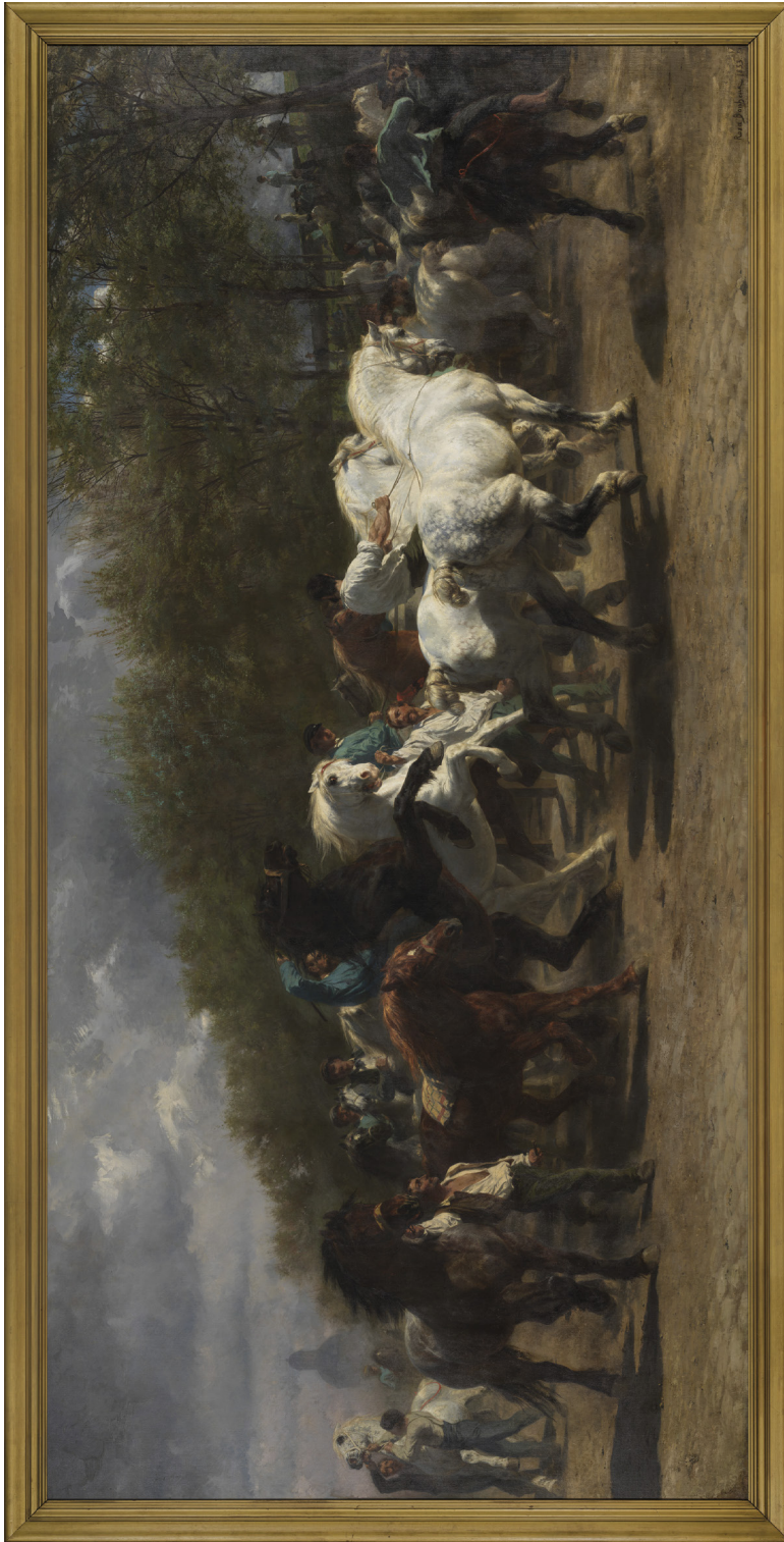
Figure 1 Rosa Bonheur, Marché aux chevaux , 1853–1855, huile sur toile, 244,5 × 506,7 cm, New York, Metropolitan Museum of Art.