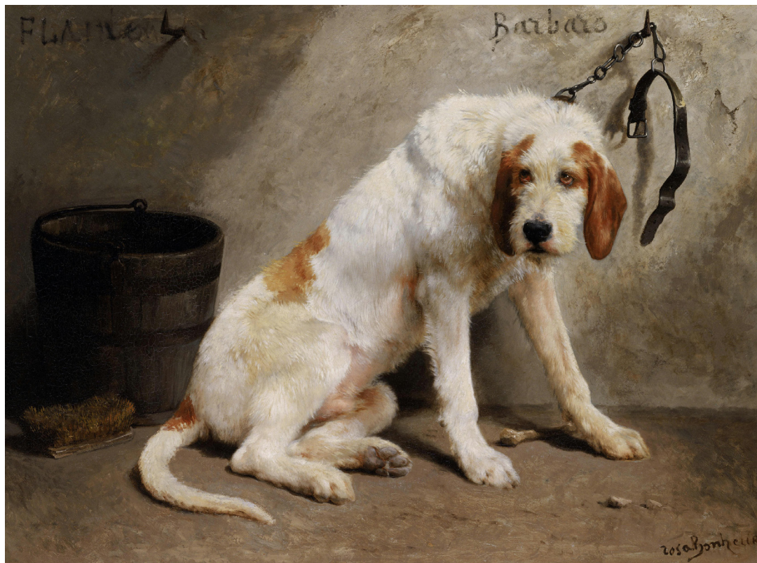
Figure 6. Rosa Bonheur, Barbaro après la chasse , 1858, huile sur toile, 96,5 × 130,2 cm, Philadelphia Museum of Art.