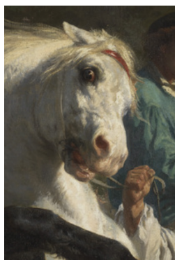
Figure 7. Rosa Bonheur, Marché aux chevaux , détail, 1853–1855, huile sur toile, 244,5 × 506,7 cm, New York, Metropolitan Museum of Art.