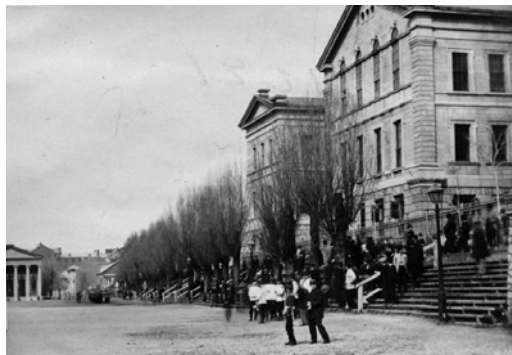
Figure 2. William Notman, Champ-de-Mars behind the Court House , 1866, photographie, sels d'argent sur papier monté sur papier/papier albuminé, 8 x 5 cm. Montréal, Musée McCord, I-20783.1. Photo: Musée McCord.