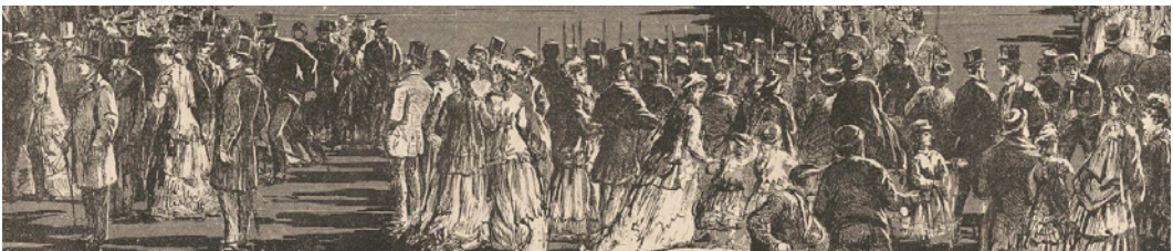
Figure 6. Détail de la figure 1.