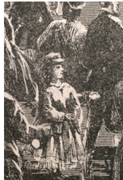
Figure 7-8. Détails de la figure 5.