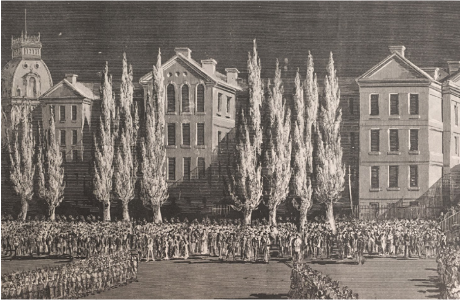
Figure 5. (Détail de) James Weston, Celebration of the Queen's Birthday at Montreal. Volunteers Drilling for the Queen's Birthday, on the Champs de Mars, by Aid of the Electric Light , 1879, photolithographie, dans Canadian Illustrated News , 31 mai 1879, Montréal, p. 349. Collections du Musée McCord.