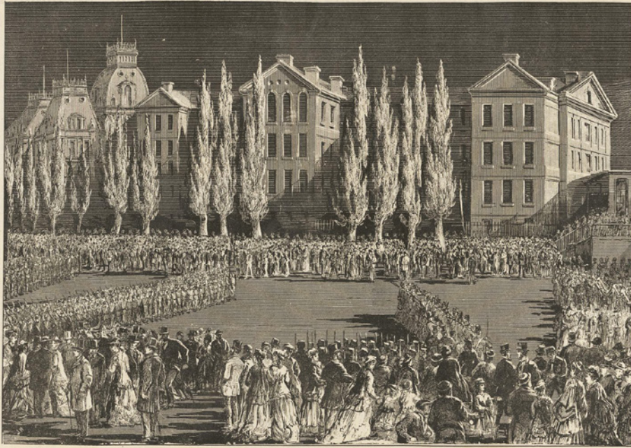
MONTRÉAL.—VOLUNTEERS DRILLING FOR THE QUEEN'S BIRTHDAY, ON THE CHAMP DE MARS, BY AID OF THE ELECTRIC LIGHT. CELEBRATION OF THE QUEEN'S BIRTHDAY AT MONTRÉAL.