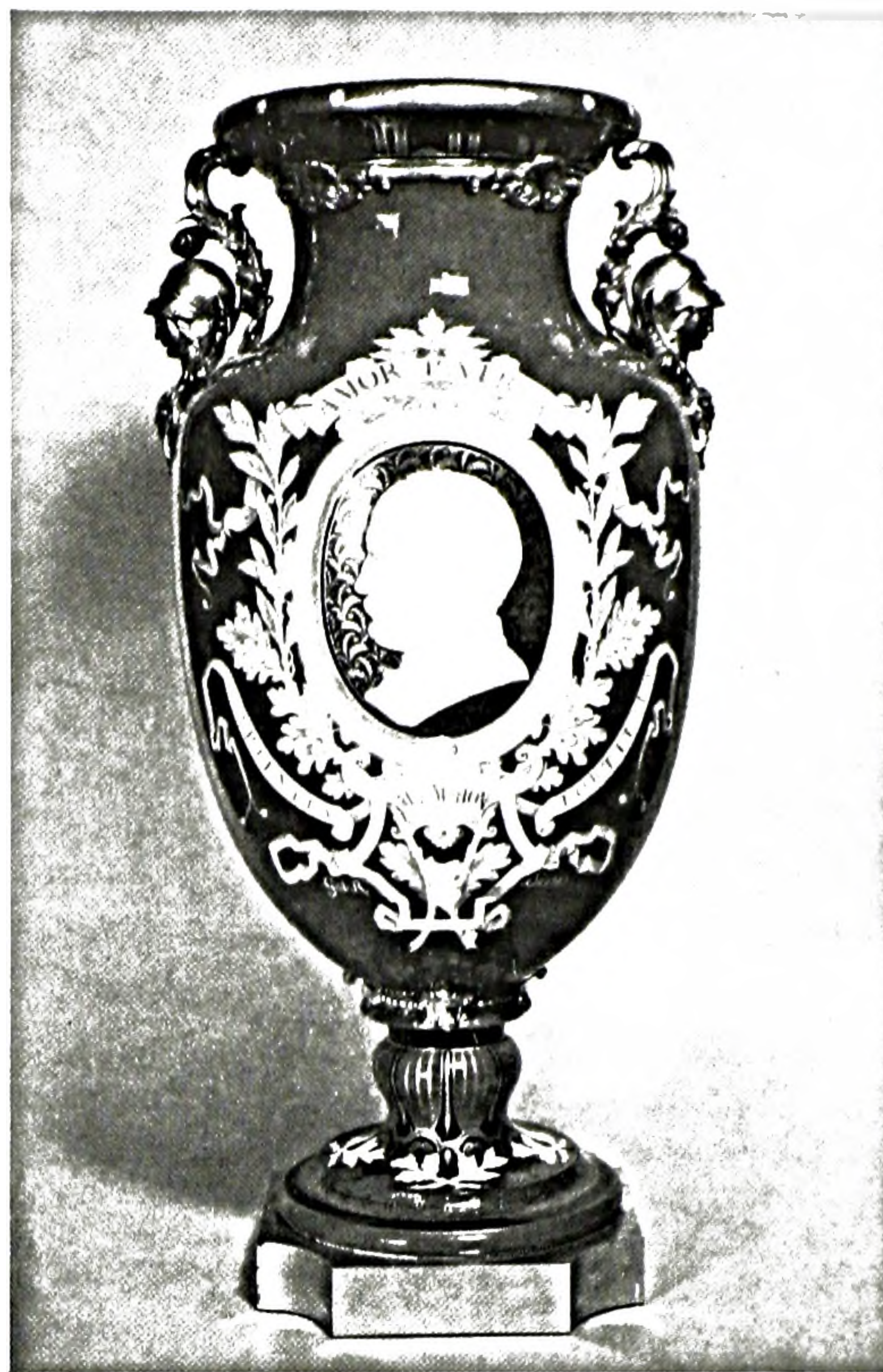
FIGURE 6. Vase de la vendange ; portrait de Mac-Mahon et ornements en pâte blanche par Alfred-Thompson Gobert, 1873-74. Porcelaine de Sèvres, 89,2 × 43,8 cm. The Cleveland Museum of Art, collection Thomas L. Fawick.

Ces objets furent de nouveau présentés en 1851 à Londres lors de la première Exposition univer-