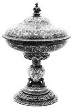
FIGURE 4. Coupe de Henri II , forme créée en 1842, exemplaire non daté. Sévres, Musée national de céramique, inv. MNC. 6564.