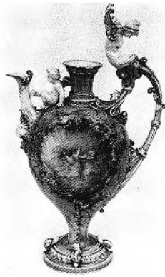
FIGURE 5. Buire de Blois , forme créée par Albert Carrier-Belleuse et mise au point par Roger et Rodin en 1884, exemplaire décoré en 1887. Sévres, Musée national de céramique, inv. MNC. 9151.

bleu ornements en émail blanc copiés sur une coupe en faïence de même grandeur et de même forme du règne de Henri II 42 . On mesure le degré de liberté que l'époque se permettait par rapport à ses modèles, pour copier en porcelaine une faïence de Saint-Porchaire. Une coupe semblable, exposée en 1846, se rapprochait déjà plus de l'original puisqu'elle portait des « ornements... par incrustations de pâtes de couleurs 43 ». Reconnaissons que, au contraire de l'atelier d'émaillage, celui de faïences abandonna rapidement les modèles qui avaient conduit à son ouverture.