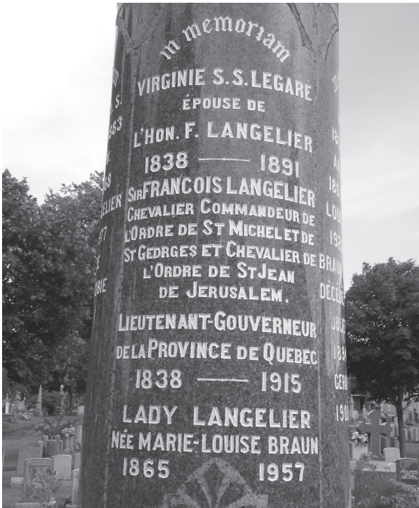
Colonne cylindrique, monument F. Langelier

Sur la colonne cylindrique qui marque l'emplacement des restes mortels de François Langelier, la présence de la fleur de lys héraldique confirme sa carrière politique : avocat, juge, député, maire de la Ville de Québec (1882-1890) et lieutenant-gouverneur (1911-1915). Motif parmi les plus anciens qui apparaît dès 1720 dans la ferronnerie québécoise 19 , insigne royal de la France 20 , la fleur de lys pare aussi les pierres tumulaires verticales du docteur Valmont Martin (1875-1938) et du marchand de vêtements Téléspore Simard (1863-1955), également maires de Québec. Elle décore les tombeaux d'autres maires et personnages politiques éminents au cimetière Notre-Dame-de-Belmont : le mausolée du juge Ulric-Joseph Tessier (1817-1892) ; l'obélisque du lieutenant-gouverneur René-Édouard Caron (1800-1876) ; la croix du ministre Pierre Garneau (1823-1905) ; la stèle du lieutenant-colonel Henri-Edgar Lavigreur (1867-1943).