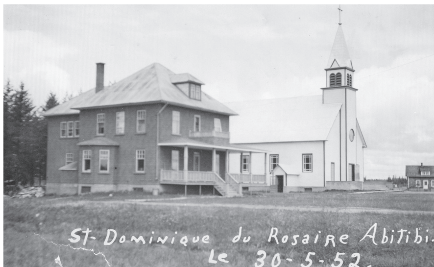
Église et presbytère de Saint-Dominique-du-Rosaire, Abitibi, 1952

Ce qui nous surprend en arrivant à Amos, c'est la cathédrale, bijou d'architecture aujourd'hui mondialement reconnu. L'église est vraiment d'une beauté et d'une dimension immense pour le village d'un peu plus de mille habitants. Mais le pasteur, un peu prophète, savait bien qu'un évêque y viendrait un jour pour fonder un diocèse, et le curé voulait l'accueillir dans un temple digne de sa fonction. Quant aux Amossois, ils se doutaient bien qu'ils en auraient pour longtemps à payer un monument religieux aussi gigantesque, calqué sur l'église Saint-Pierre de Rome. Mais il n'y eut pas de rébellion, en ces temps de foi profonde. Les gens d'Amos sont fiers de leur cathédrale qui est une de leurs importantes attractions touristiques, tant par son style romano-byzantin que par ses dimensions hors de l'ordinaire. Aujourd'hui Amos est une ville d'environ quinze mille habitants. Il y aurait beaucoup de choses à dire sur cette belle ville ; le temps me manque.