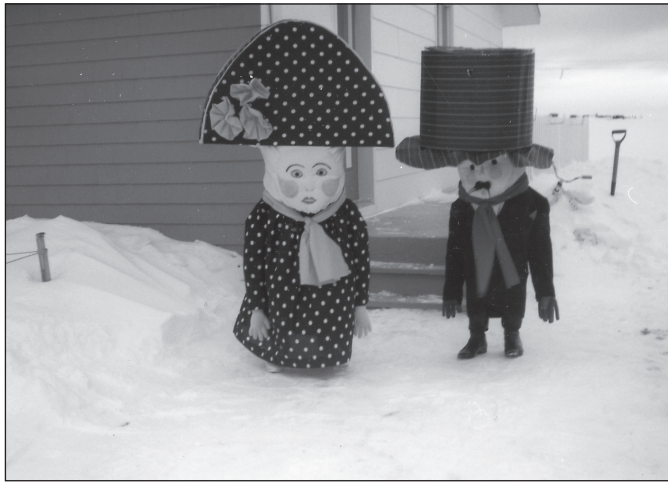
3. Les grosses têtes (collection Bérangère Landry, 1994).