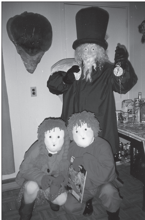
4. Peur du Bonhomme-Sept-Heures (collection Bérangère Landry, 1998).