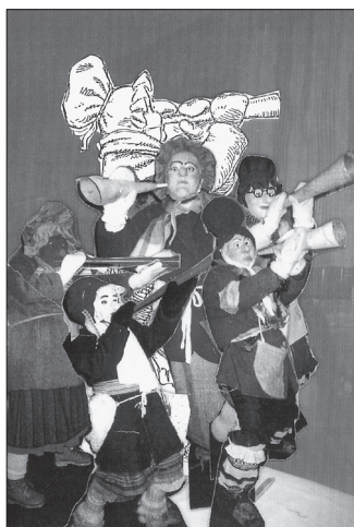
5. La visite des Mardi-Gras (collection Bélangère Landry, 1997).

Entre nous aussi, nous aimons bien nous jouer des tours et garder des secrets. Une année, je dis à tout le monde : « Je vous envoie l'image "La visite des mardis-gras" de Massicotte, illustrée en 1911 et chacun l'interprète à sa façon, en secret. Seule contrainte chacun doit faire son masque. » (ill. 5) Ce fut un projet créateur qui a fait jaser. Mon masque