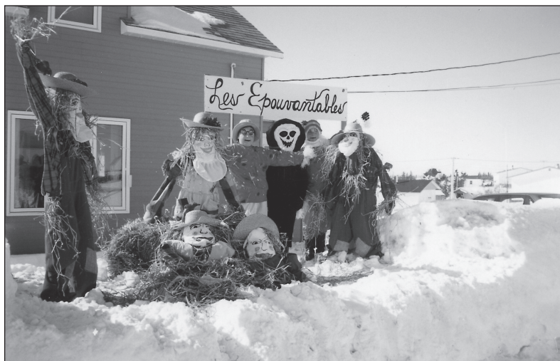
1. Les Épouvantables devant la maison paternelle (collection Bérangère Landry, 1995).

comme une courte suspension des interdictions, un jour et une nuit de joie et de festins. Elle deviendra la fête des Halles et des Marchés 1 .