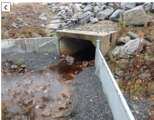
Figure 2. Exemples de ponceaux suivis et de clôtures d'exclusion sur les sites d'études: a) caméra installée au-dessus d'un ponceau le long de la route 83, dans la réserve faunique nationale de Valentine (Nebraska, États-Unis); b) tortue serpentine se déplaçant le long de la clôture à mailles métalliques en bordure de la route 83 au Nebraska, États-Unis; c) ponceau avec clôtures d'exclusion et roches dirigeant les animaux sous la caméra, le long de l'autoroute 69 en Ontario, Canada.