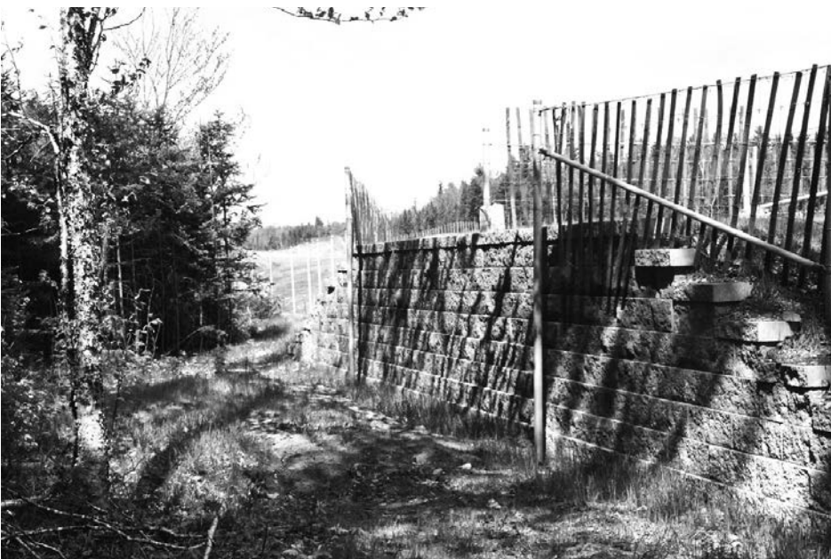
Figure 2. Un des 30 sautoirs installés dans le ravage de cerfs de Virginie de Calway dans le secteur du prolongement de l'autoroute Robert-Cliche (73), Saint-Joseph-de-Beauce, Québec. En haut: Vue de la pente douce du côté de l'autoroute. Ci-dessous: Vue du mur vertical du côté de la forêt.