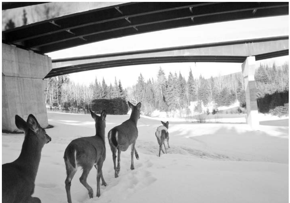
Figure 3. Cerfs de Virginie utilisant, en hiver, le passage faunique sous le pont de la rivière des Plante dans le ravage de la rivière Calway, dans le secteur du prolongement de l'autoroute Robert-Cliche (73), Saint-Joseph-de-Beauce, Québec.

Avant la construction de l'autoroute, 35 des 49 cerfs (71%) qui portaient un collier émetteur occupaient en hiver un domaine vital incluant le futur emplacement de l'autoroute. Les autres cerfs avaient un domaine vital restreint à un seul côté de l'emprise, soit 12 (25%) du côté est et seulement 2 (4%) du côté ouest. Plusieurs cerfs ont modifié leur patron d'utilisation de l'aire d'hivernage pendant ( n = 203 , P < 0,001 ) et après ( n = 203 , P < 0,001 ) la construction de l'autoroute. En effet, les cerfs occupant un domaine vital incluant l'autoroute (grâce aux passages fauniques) sont passés à 26 (46%), alors que ceux qui avaient leur domaine vital du côté est ont diminué à 7 (12%) et ceux qui ne fréquentaient que le côté ouest ont augmenté à 24 (42%). La proportion de cerfs résidents fréquentant le ravage toute l'année n'a pas changé significativement au cours des 3 périodes et atteignait 38% (15 sur 39), 37% (33 sur 90) et 41% (22 sur 54) avant, pendant et après la construction de la route, respectivement ( n = 183 , P = 0,608 ).