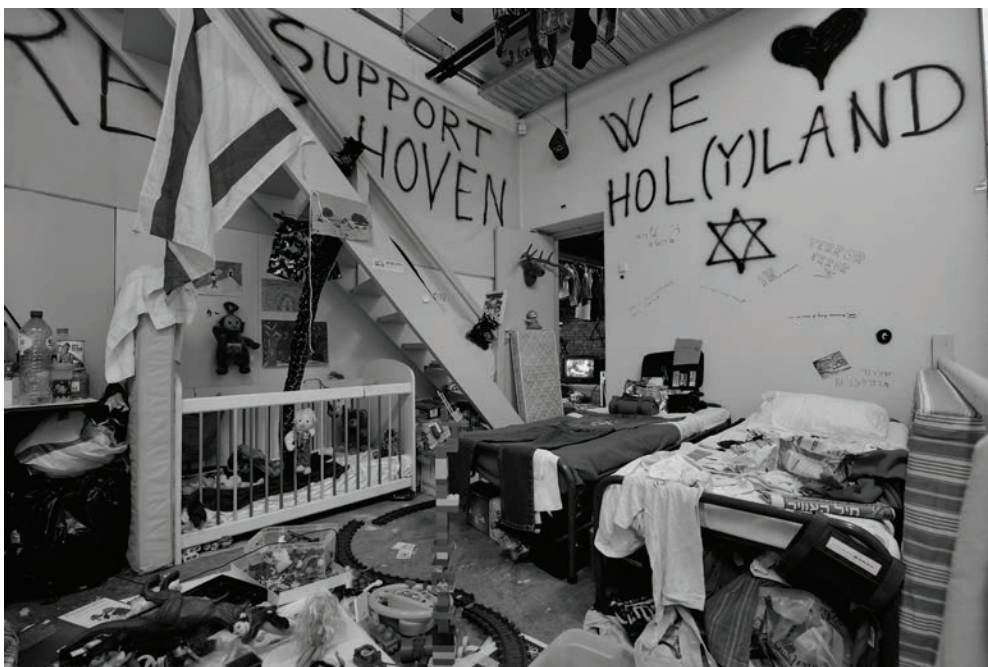
Michael Blum, "Exodus 2048", Van Abbemuseum, Eindhoven, 2008.