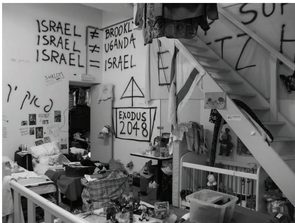
Michael Blum, "Exodus 2048", Van Abbemuseum, Eindhoven, 2008.