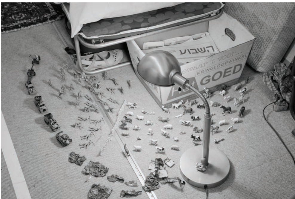
Michael Blum, "Exodus 2048", New Museum, New York, 2009.