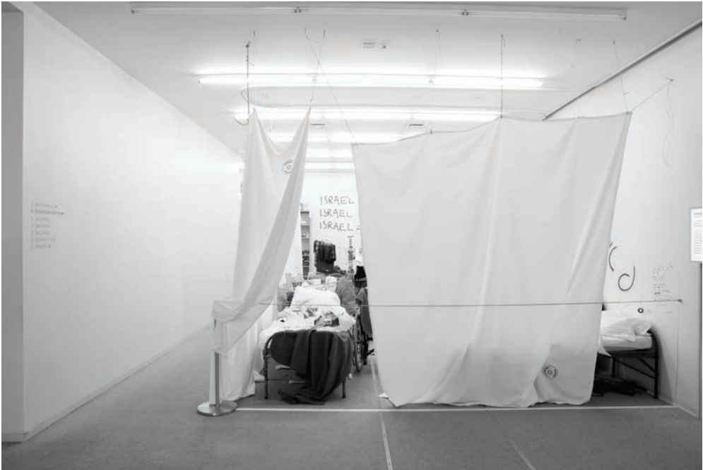
Michael Blum, "Exodus 2048", New Museum, New York, 2009.