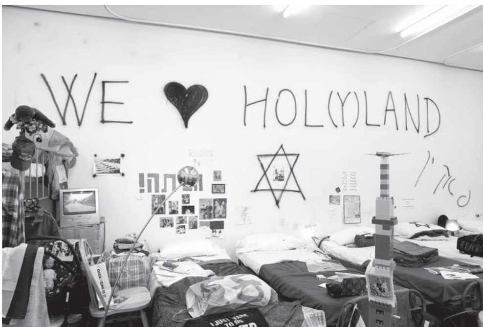
Michael Blum, "Exodus 2048", New Museum, New York, 2009.