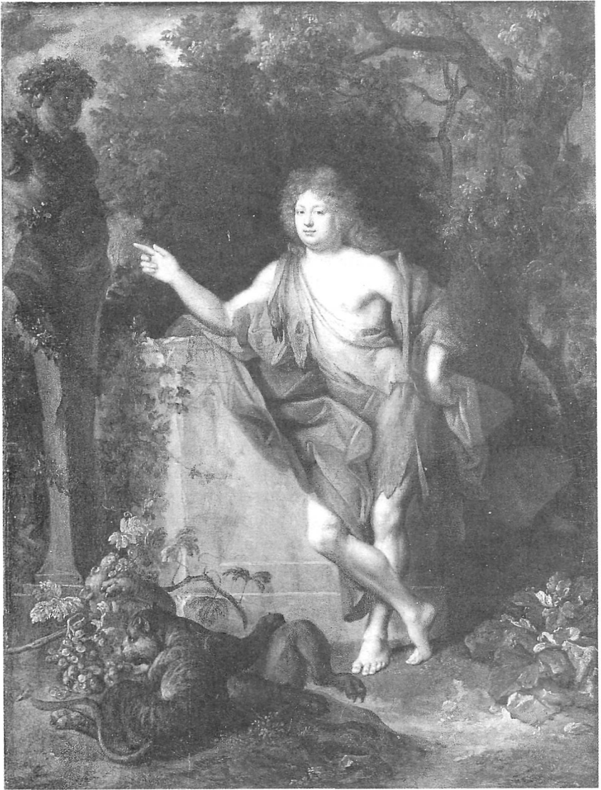
Fig. 3 Portrait allégorique dit: Le Régent en Dieu Pan. Louvre, inv. R. F. 2155

tout cela annonce quelques thèmes centraux de la philosophie des Lumières. La peinture y participe à sa manière.