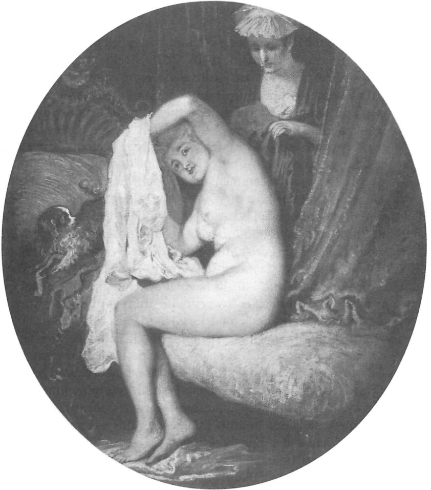
Fig. 4 La toilette . Londres, Wallace Collection (C.-R. 175)

aucun vice ne le dominait et il n'a jamais fait aucun ouvrage obscène. Il poussa même la délicatesse jusqu'à désirer, quelques jours avant sa mort, de ravoïr quelques morceaux qu'il ne croyait pas assez éloignés de ce genre, pour avoir la satisfaction de les brûler: ce qu'il fit. 43