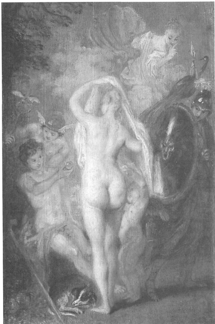
Fig. 2 Le Jugement de Pâris . Paris Louvre (C.-R. 210) © «Cliché Musées nationaux».