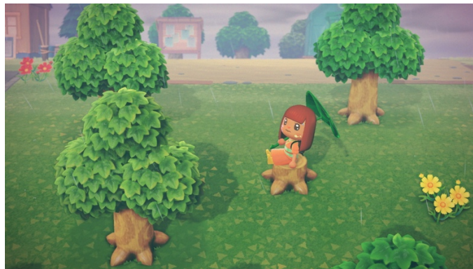
Figure 1 : Mon île au commencement (29 mars 2020)

Dans mon cas, différents éléments indiquent que j'appartiens à la communauté d' AC:NH . J'ai tout d'abord joué plus de 600 heures (voir figure 1 et 2), ce qui m'a permis de débloquent plusieurs « accomplissements » ( achievements ) du jeu : mon île possède cinq étoiles (le nombre maximal), la maison de mon avatar a obtenu les plus hautes récompenses en matière de design d'intérieur et plusieurs personnages non jouables habitant l'île m'ont témoigné leur amitié en m'offrant leur portrait. De plus, en adhérant à des groupes dédiés au jeu, j'ai échangé avec de nombreuses personnes sur le jeu, dont mes étudiant·e·s en design de jeux, mes ami·e·s, ainsi que des inconnu·e·s rencontré·e·s en ligne.