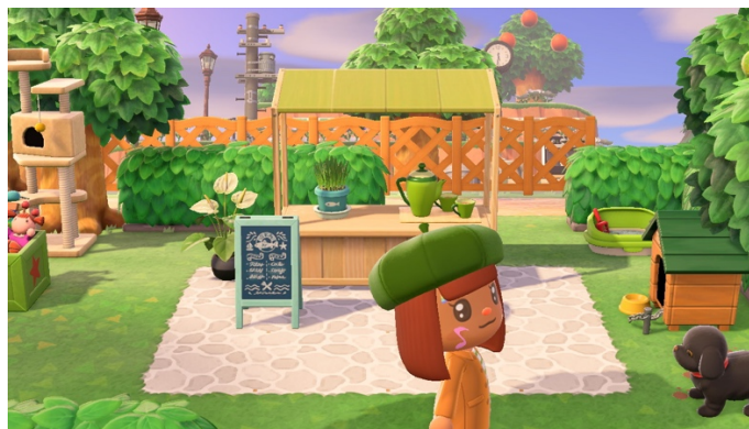
Figure 9 : Parc pour chiens et chats (18 mai 2021)

La création du « parcours canadien » m'a permis d'agir de manière non téléologique, mais il m'a offert aussi un exemple de moment réflexif. Je suis née en France et j'ai émigré au Canada il y a une dizaine d'années. Je suis donc confrontée à des questions liées à mon identité, que l'on peut qualifier de « multiple ». Au moment de la pandémie, mes liens avec l'Europe sont revenus au premier plan puisque, pendant que le Canada était relativement épargné, l'Europe composait déjà avec la situation dramatique engendrée par le virus.