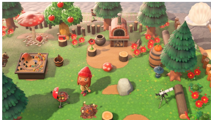
Figure 6 : La voie de chemin de fer au fond (18 mai 2021)