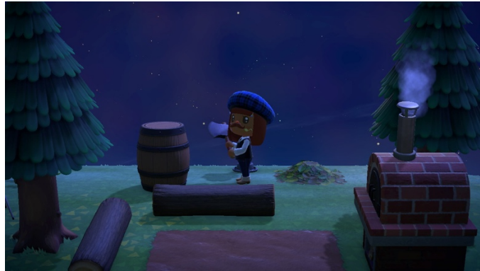
Figure 3 : Les débuts de mon aire canadienne (20 avril 2020)

Deux éléments sont venus compléter cet aspect rustique : tout d’abord, un premier pont en billots de bois imposé par le jeu et ensuite, l’arrivée d’un nouvel habitant, un petit ours vert grincheux nommé Murphy qui vit dans une imposante cabane en rondins (voir figure 4). Chaque île peut accueillir un maximum de dix habitants (excluant le·la joueur·se) et si la façade de la maison des joueur·se·s peut être personnalisée, celles des villageois·e·s ne peuvent être changées autrement qu’en achetant et terminant l’extension Happy Home Paradise (Nintendo, 2021). J’ai donc vu la cabane de Murphy comme une chance supplémentaire d’évoquer le Canada !