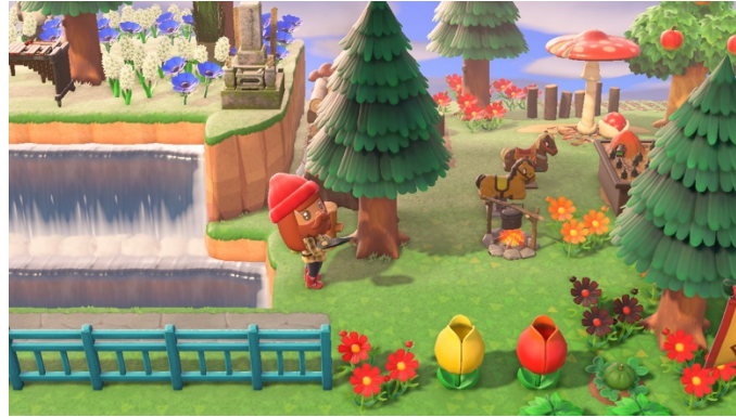
Figure 7 : La double chute d'eau (18 mai 2021)

La couleur rouge du drapeau canadien est apparue progressivement dans ma création grâce à l'ajout d'objets comme des champignons, des pommiers, des fleurs, etc. J'ai même rajouté une double chute d'eau rappelant les chutes du Niagara ou celles de Montmorency (voir figure 7). J'ai finalement été étonnée par le nombre d'éléments me permettant d'évoquer le Canada avec ses forêts, ses lacs, ses chalets, ses chemises de flanelle, etc.