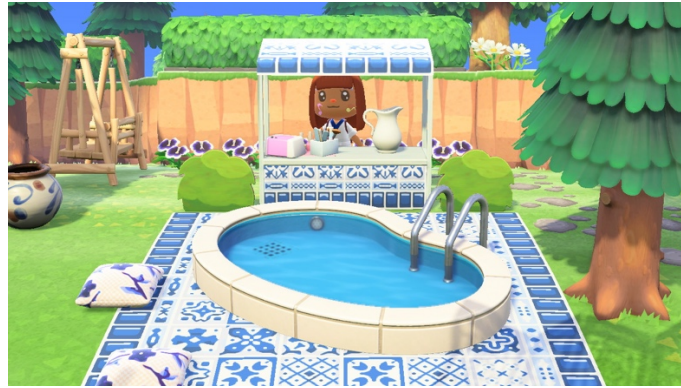
Figure 11 : Le motif de carrelage en faïence blanc et bleu créé par Miranda (1 er mai 2020)

L'importation de motifs dans AC:NH facilite la personnalisation et la mise en scène de thèmes très précis. Cependant, je préfère généralement utiliser ce que le jeu offre par défaut. Je me suis alors questionnée sur cette posture : pourquoi, alors qu'il ne s'agit pas d'un piratage ou de triche, mais bien d'une possibilité du jeu, ai-je tendance à vouloir éviter de sortir du cadre originel créé par les designers de Nintendo ? J'ai réalisé que je me limitais au contenu fourni pour rester dans l'esprit du jeu. Comme joueuse des précédents opus d' Animal Crossing , je reste attachée à l'idée de simulation de vie : mon île est un endroit que je construis pour mes habitant·e·s en les imaginant en train de se promener ou d'utiliser ses installations. Ainsi, j'ai l'impression de respecter la vision des concepteur·rice·s. Je m'imagine dialoguant avec eux·elles et j'ai l'impression de rendre hommage à leur travail. Pour moi, la créativité dans AC:NH ne consiste pas tant à briser le système ni à repousser ses limites ou à créer mon propre contenu, mais bien à construire avec ce qui m'est fourni. Le plaisir du jeu consiste alors à créer dans la limite imposée, en inventant des buts possibles : c'est là que se situe le défi lié à la conversation avec la situation (et la possible résistance de cette situation) que je retrouve également dans mes projets de design.