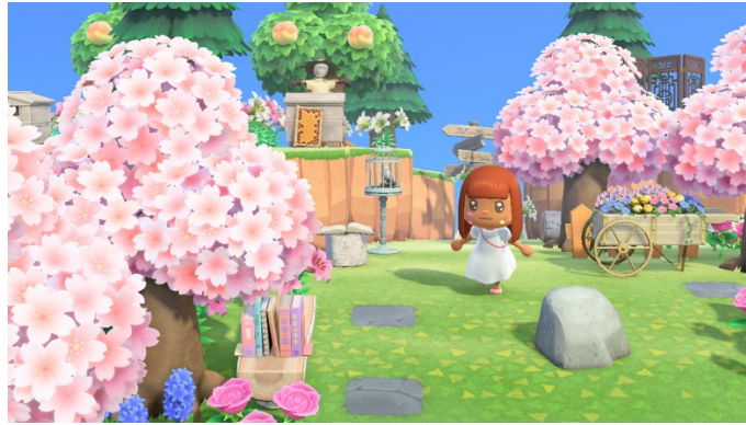
Figure 12 : Course sous les cerisiers en fleurs (21 avril 2021)

En offrant une situation de jeu dans laquelle je pouvais mener une activité de design et continuer à exercer ma créativité, AC:NH m'a permis de modifier et d'enrichir la situation pandémique face à laquelle je me trouvais démunie dans le monde « hors jeu » et d'être réflexive. Cette hypothèse appuie celle des études qui affirment que la créativité est bénéfique en temps de pandémie (Kapoor et Kaufman, 2020 ; Mercier et al. , 2021) et celle des études qui montrent que le jeu encourage l'autodétermination (Comerford, 2020). Le dialogue réflexif que permettent les jeux de construction est, pour moi, ce sur quoi repose en partie leur fonction de remède en temps de pandémie.