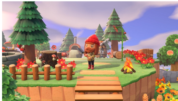
Figure 5 : L'escalier en rondin (18 mai 2021)

pour accéder à l'aire délimitée. J'avais ainsi construit une sorte d'entrée semblable à celles des parcs nationaux canadiens. Puisqu'au Canada, les grands parcs sont principalement accessibles par voiture, j'ai choisi d'y placer une pompe à essence et un seau d'eau. La cabane du petit ours vert est donc devenue une sorte de hutte de garde forestier. Dès que j'ai réussi à acquérir les fonds suffisants, j'ai balisé l'entrée du parc au moyen de barrières et de chemins en bois. J'ai également construit un escalier en rondins qui mène à une petite aire d'activité et de pique-nique au milieu des sapins (voir figure 5).