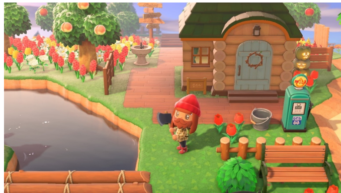
Figure 4 : La cabane en bois de Murphy et le pont en rondins (18 mai 2021)

Deux éléments sont venus compléter cet aspect rustique : tout d’abord, un premier pont en billots de bois imposé par le jeu et ensuite, l’arrivée d’un nouvel habitant, un petit ours vert grincheux nommé Murphy qui vit dans une imposante cabane en rondins (voir figure 4). Chaque île peut accueillir un maximum de dix habitants (excluant le·la joueur·se) et si la façade de la maison des joueur·se·s peut être personnalisée, celles des villageois·e·s ne peuvent être changées autrement qu’en achetant et terminant l’extension Happy Home Paradise (Nintendo, 2021). J’ai donc vu la cabane de Murphy comme une chance supplémentaire d’évoquer le Canada !