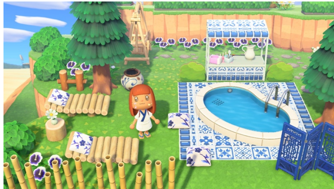
Figure 10 : Mon spa extérieur (1 er mai 2020)

Un autre exemple me semble encore plus parlant pour montrer comment le jeu m'a permis de mettre en perspective ma relation avec le design et de faire preuve de réflexivité : la création d'un spa en plein air (voir figure 10).