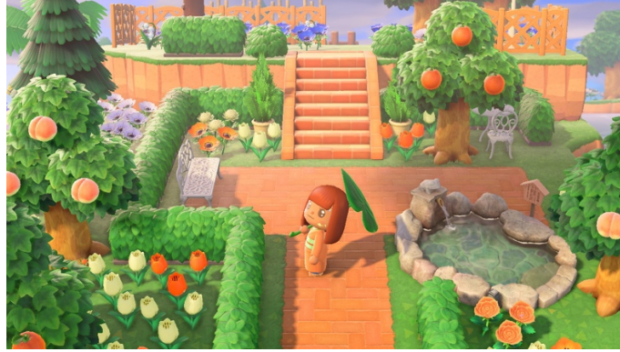
Figure 2 : Mon île un an après (18 mai 2021)

Les outils habituellement utilisés dans le cadre d'une autoethnographie sont les notes de terrains, les entrevues, l'analyse d'artéfacts, etc. Dans mon cas, j'ai documenté mon expérience de jeu à travers des notes de terrain, mais surtout grâce aux très nombreuses captures d'écran que j'ai prises durant mes séances de jeu. Celles-ci jouent le même rôle que les photographies de personnes ou d'artéfacts collectées par les ethnographes dans les communautés qu'il·elle·s étudient.