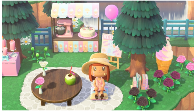
Figure 8 : Marchand de glaces (7 août 2020)