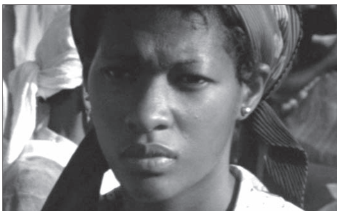
Figs. 5-7. Chris Marker, Sans soleil , 1983