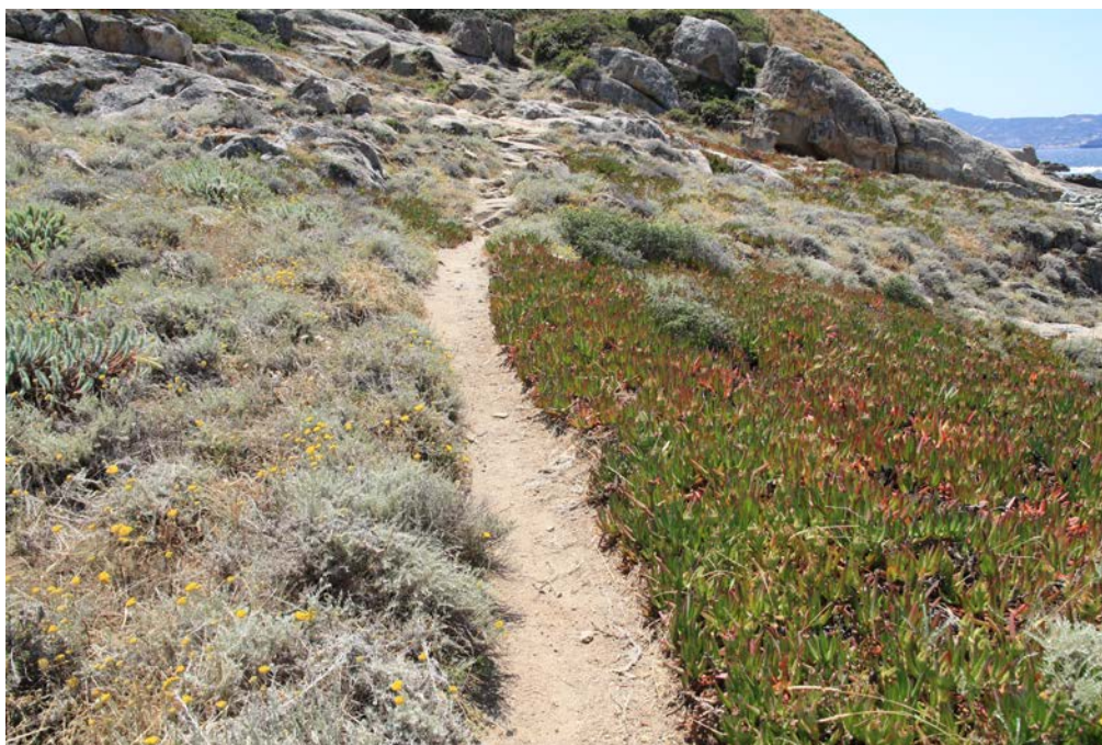
Photo 3. Sentier littoral entre Punta Caldanu et Punta di Spano, à gauche l'immortelle, à droite la griffe de sorcière

40 La reconnexion aux espaces par les sentiers passe aussi par l'interaction avec le paysage. La marche permet alors de se projeter dans l'horizon offert par la variété des paysages : voir le large en regardant côté mer, regarder les crêtes côté montagne (photo 4), le sentier est ici la matérialisation de la continuité paysagère et refait du lien entre des composantes très différentes de l'environnement. Envisager le paysage non comme une expérience esthétique élitiste et désincarnée, mais plutôt comme une expérience écologique, une « esthétique écologique » à la Kalaora, c'est le gage d'enclencher une solidarité Homme-Milieu et c'est s'engager sur la voie de la remise en cause de la segmentation nature-culture au profit de la complémentarité. Non pas l'idée naïve d'une fusion totale des éléments, mais une façon de replacer le pas de chacun dans une harmonie du monde sans déséquilibre excessif.