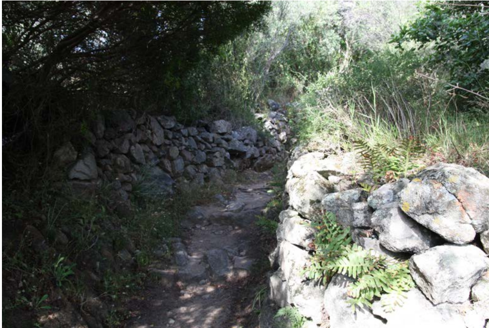
Photo 1. Sentier muletier entre Ile Rousse et Occiglino