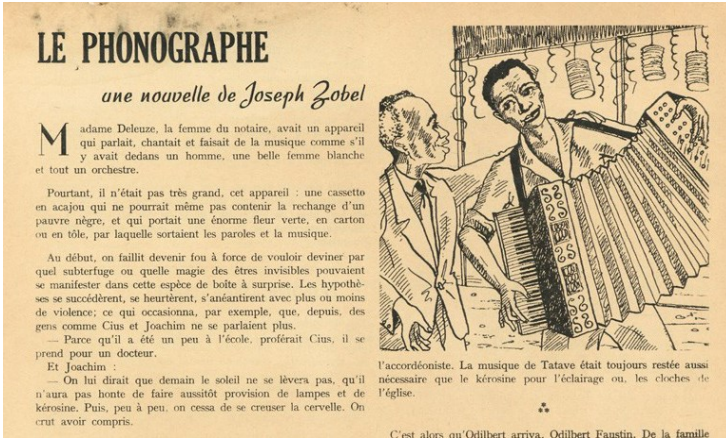
Figure 3 – Source : https://www.awamagazine.org (mai 1964).

Dans le cas du « Cadeau », de manière moins frappante, l'illustration donne à voir le moment où l'horloger, M. Atis, donne la montre au jeune narrateur : les liens entre les personnages sont alors plus importants que les indices fantastiques qui inaugurent et cloisent le récit, et l'aspect réaliste, la relation entre l'enfant et l'artisan, prend le pas sur la sorcellerie qu'annoncent les premières lignes du texte (voir figure 4).