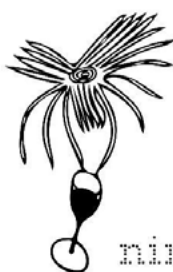
nimportekoi à jus