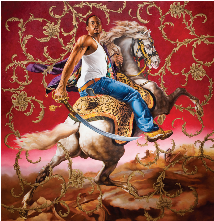
Figure 2. Kehinde Wiley, Officer of the Hussars , 2007, huile sur toile, 278,8 x 267,8 cm, Detroit Institute of Art.

C'est cette idée de courage que récupère Wiley dans sa toile, non pas pour glorifier un individu qui se serait démarqué en raison de ses bravoures militaires, mais pour mettre en exergue l'intrépidité d'un valeureux cavalier afro-américain qui, comme tous les membres de la diaspora, doit résister au jour le jour aux assauts dont il est victime pour assurer sa propre « survie ». Wiley a presque entièrement supprimé le champ de bataille visible dans le tableau source, à l'exception de quelques formes à peine profilées de couleur brune rappelant les bancs de fumée. Il lui a substitué une teinte rouge répartie dans la portion supérieure de la toile. Un seul motif évoquant le contexte de guerre illustré dans l'œuvre de Géricault est conservé par Wiley : le canon sur roues. Loin d'être accessoire, l'engin explosif remémore que le combat, non plus pour l'Empire, mais pour soi, est à la veille d'arriver à son terme. L'homme noir représenté dans l'œuvre de Wiley n'est pas attaqué de toutes parts. Il paraît confiant, comme s'il se sentait à sa place. En fait foi son regard dirigé vers le récepteur qu'il observe « de haut », position de domination