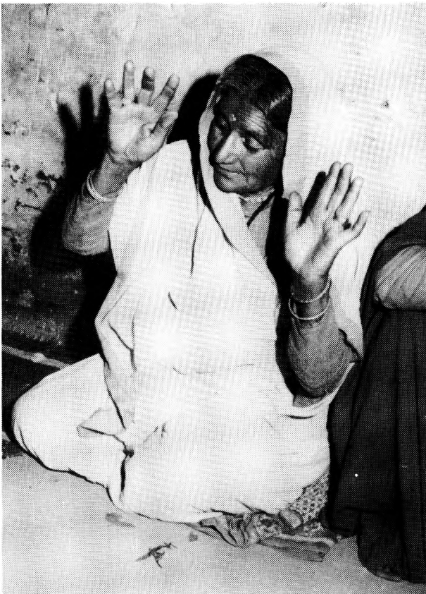
Médium en état de transe.

Le dieu qui a investi le corps du médium fait ensuite la distribution de cendres sacrées. Tout le monde en prend, car ces cendres sont censées être très bénéfiques. L'attention de la foule est alors à son maximum. Ceux qui reçoivent des cendres sont agenouillés et recueillis. Ils se concentrent sur le contact direct et physique qu'ils ont avec le sacré. Puis, par l'intermédiaire de la bouche du médium, le dieu s'adresse à la foule. Durant son discours, l'attention de l'assemblée se relâche un peu. Certaines personnes interrogent le dieu. Si ce dernier le demande, le jāgar terminera le lendemain matin