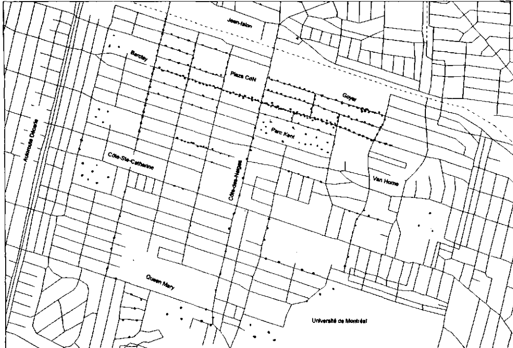
Figure 1 Distribution de la peur du crime dans un quartier de Montréal